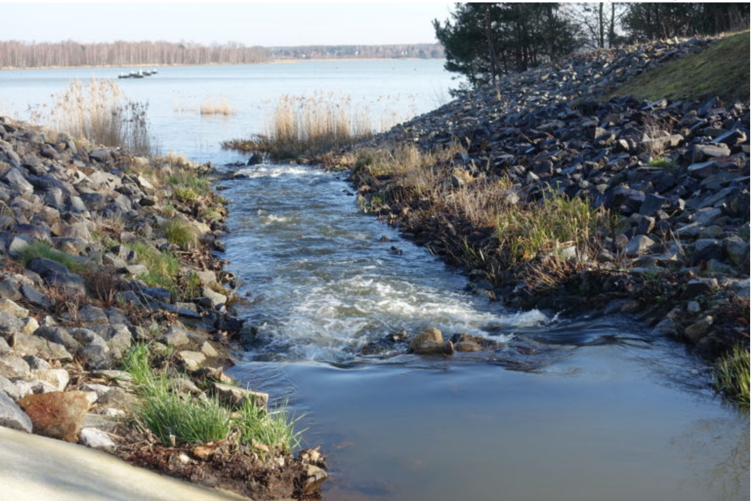
Flutungswasser aus der Kleinen Spree für das Restloch Burghammer