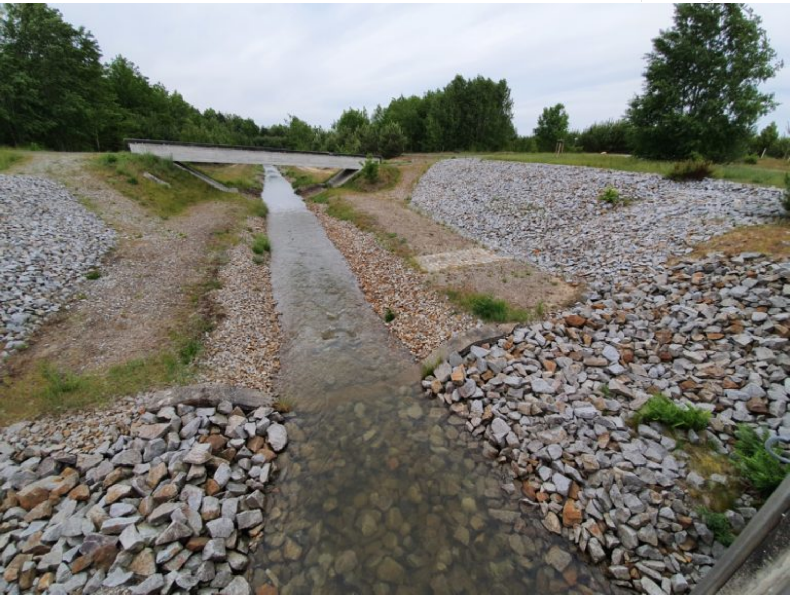
Ableiter aus dem Bergbaufolgesee und Speicher Bärwalde