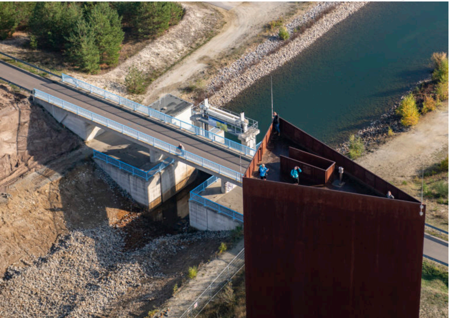
Künftig mit zu steuern: Wehranlage im Rosendorfer Kanal

Zertifikat seit 2023 audit berufundfamilie