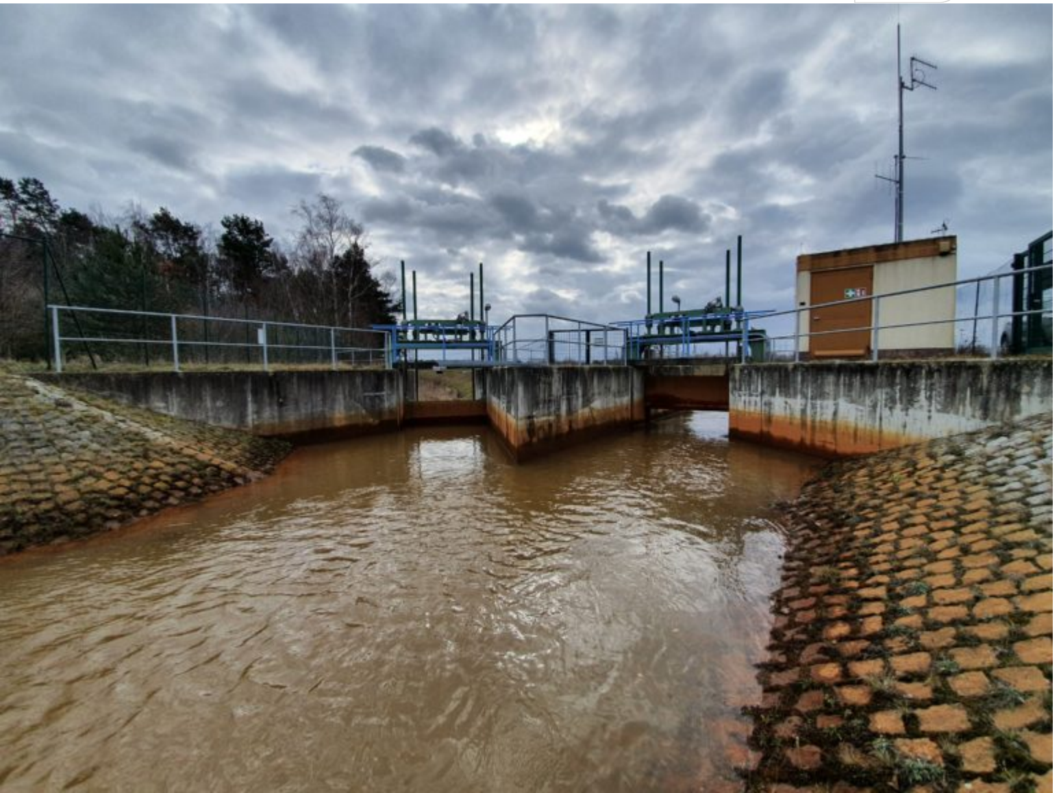
Wasserwirtschaftliche Anlage: Verteilerwehr Bluno