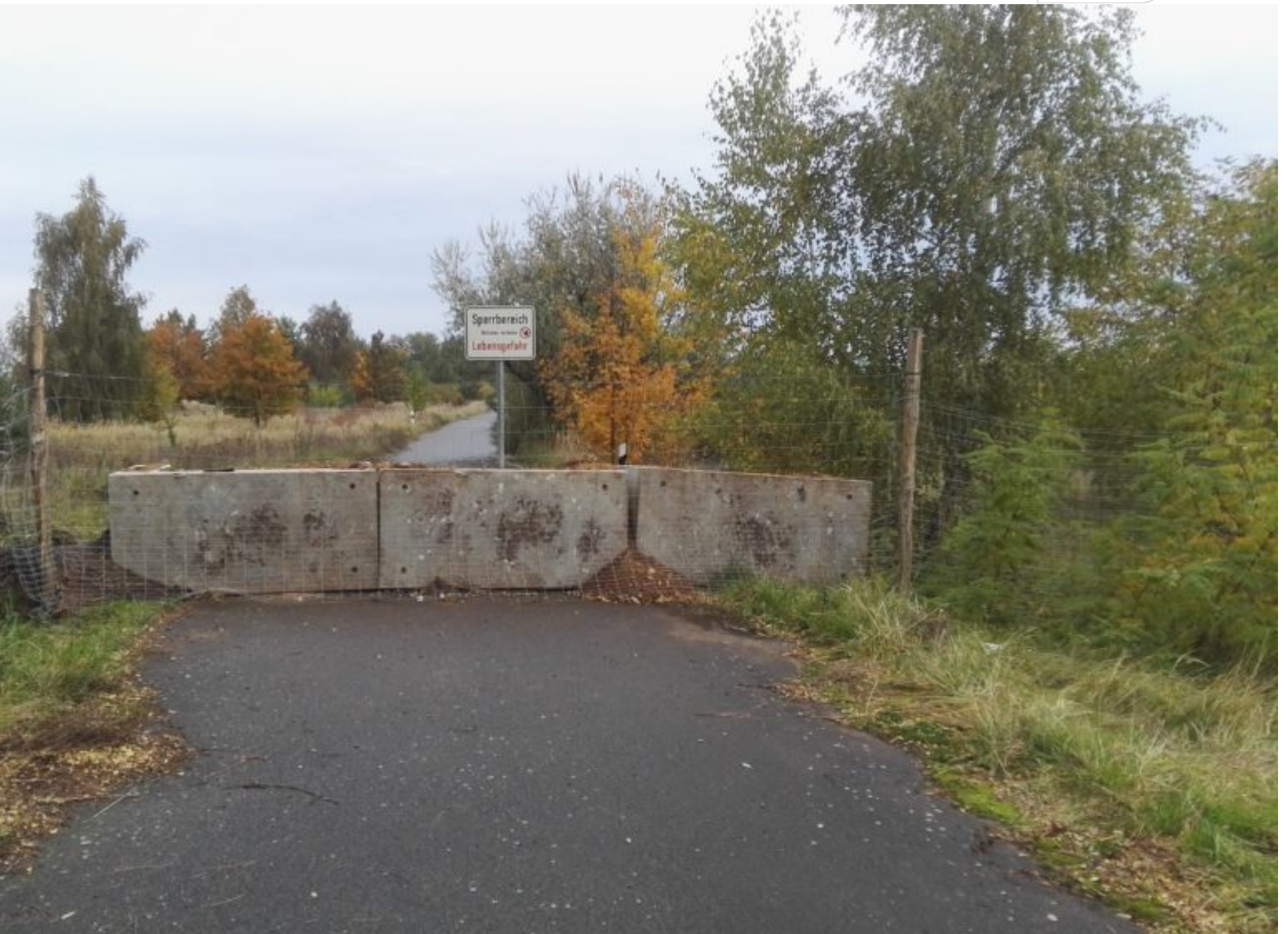
Zusätzlich gesicherte Zuwegung zur Kippe