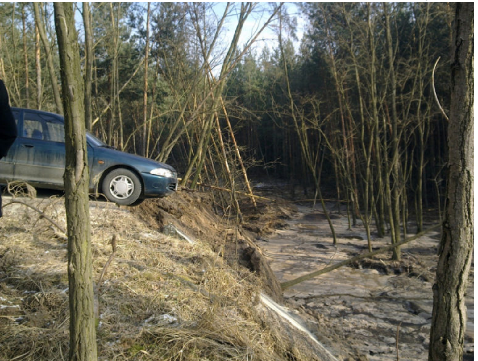
Symbolfoto: Rutschung 2016 in Sperrgebiet