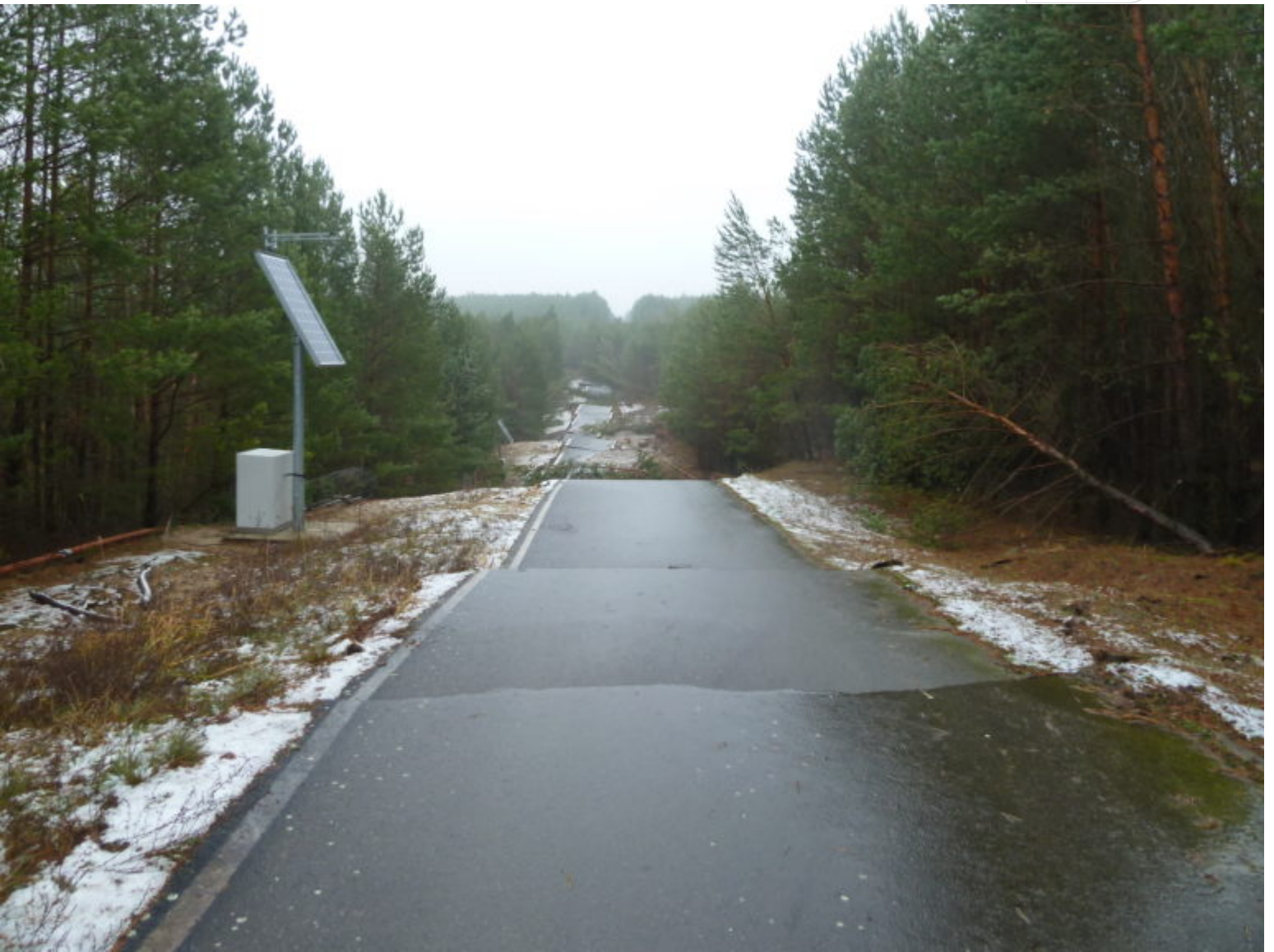
Auf der Kippe: In Mitleidenschaft gezogener Weg – nach Kippenbodenbewegung