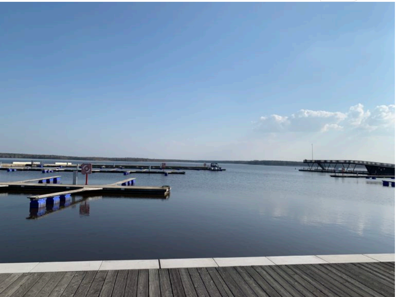
Blick auf den Senftenberger See – Hafen am 7. April 2020

Zertifikat seit 2023 audit berufundfamilie