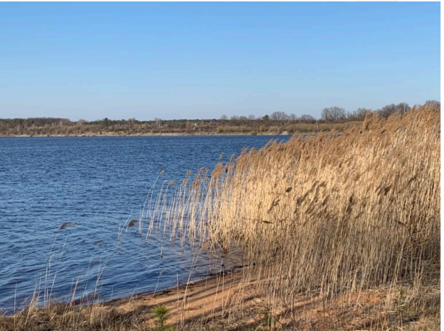
Schilf am Senftenberger See - Großkoschener Uferseite