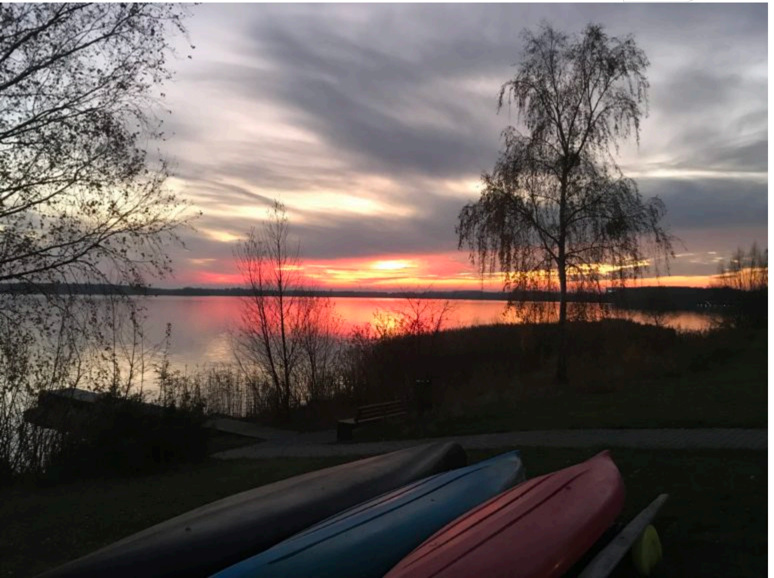
Abendrot am Senftenberger See