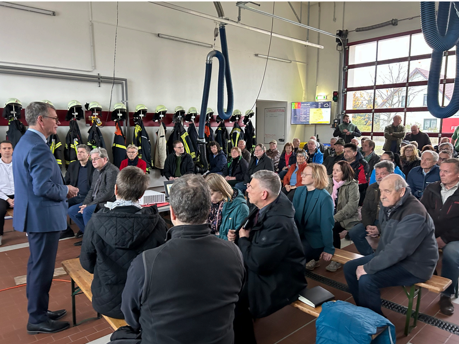
Gut besucht war die Infoveranstaltung der LMBV im Gebäude der FFW in Sedlitz.

Zertifikat seit 2023 audit berufundfamilie