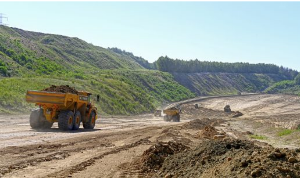
Beispiel: Anstützen der Südwestböschung der Kippe Wulfersdorf

Zertifikat seit 2023 audit berufundfamilie