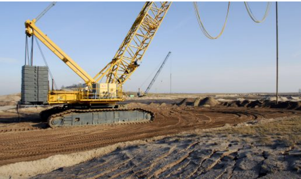
Beispiel: Verdichtung der Innenkippe Schlabendorf

Zertifikat seit 2023 audit berufundfamilie