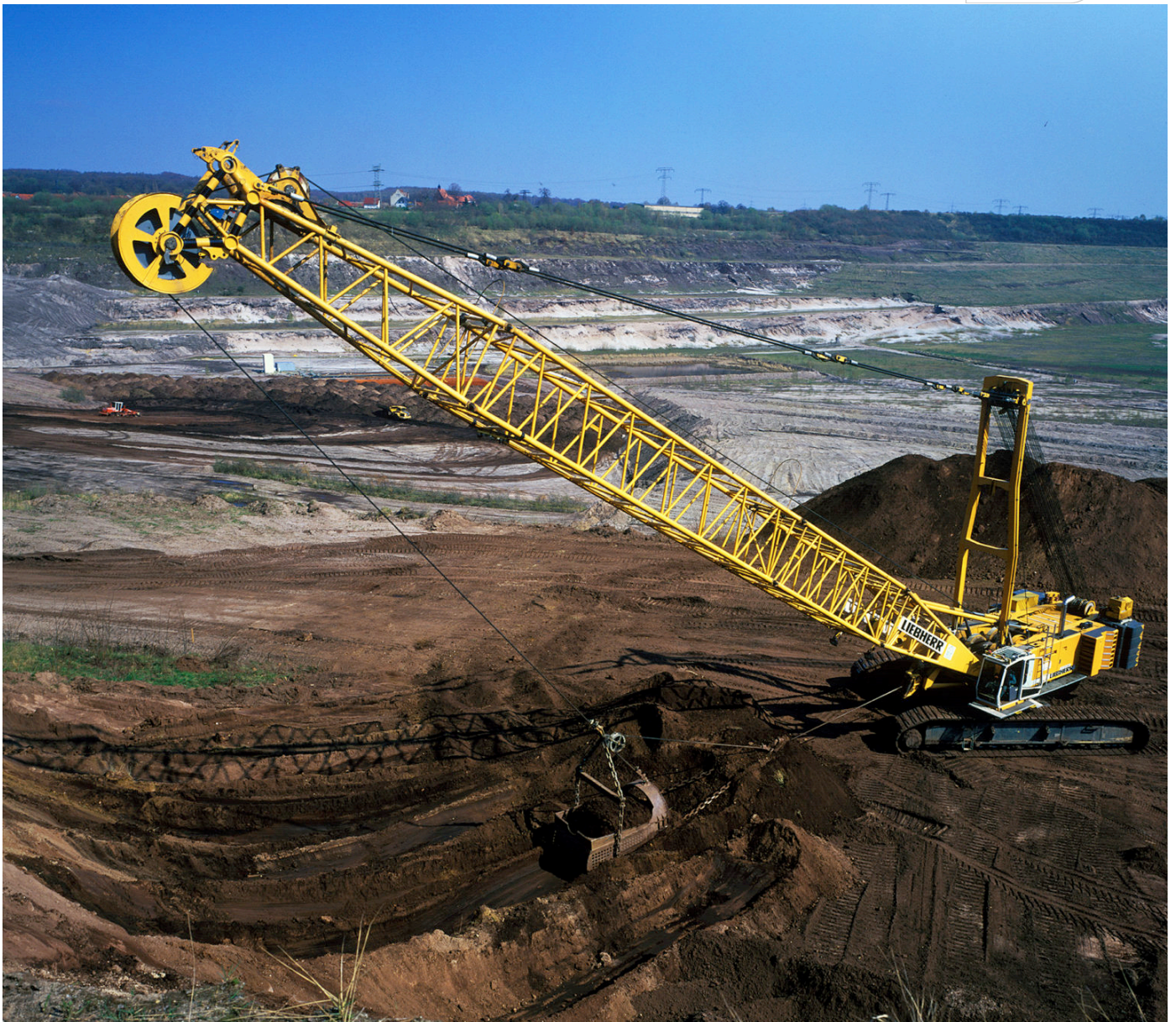
Sanierungsarbeiten im ehemaligen Tagebau Wulfersdorf

Zertifikat seit 2023 audit berufundfamilie