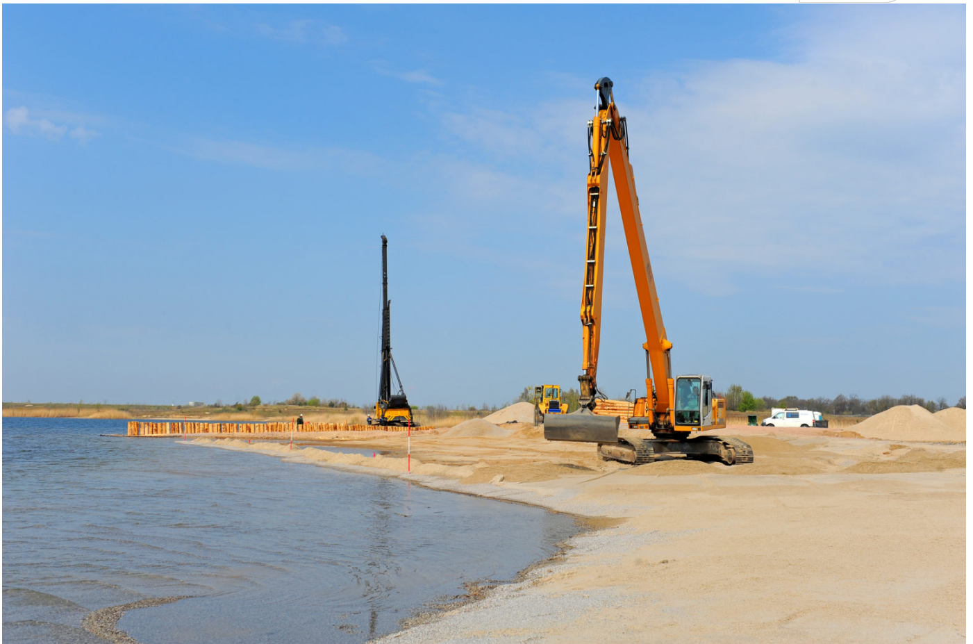
Ufersicherung am Restloch R□ösa

Zertifikat seit 2023 audit berufundfamilie