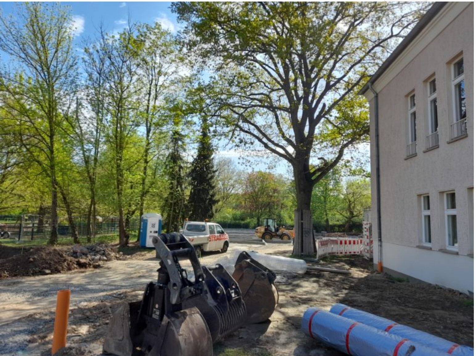
Einer der zwei neuen Parkplätze entsteht gegenüber des Bühneneinganges.