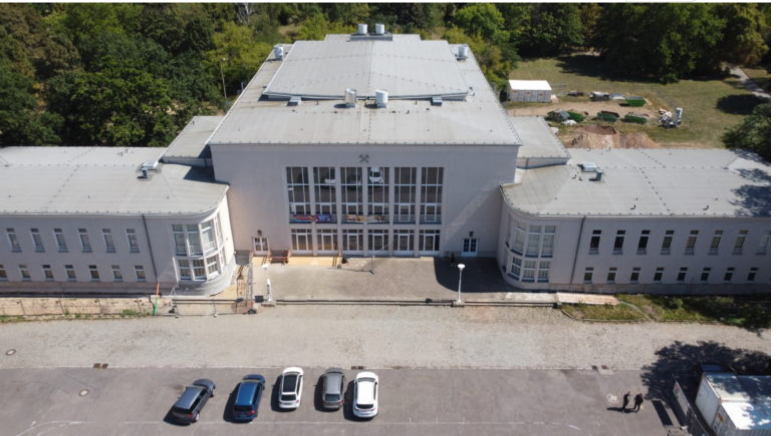
Luftaufnahme des Kulturhauses Böhlen vom August 2022

Zertifikat seit 2023 audit berufundfamilie