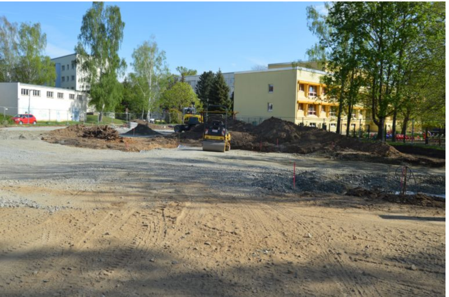
Der zweite neue Parkplatz entsteht ebenfalls nordöstlich des Kulturhauses.

Zertifikat seit 2023 audit berufundfamilie