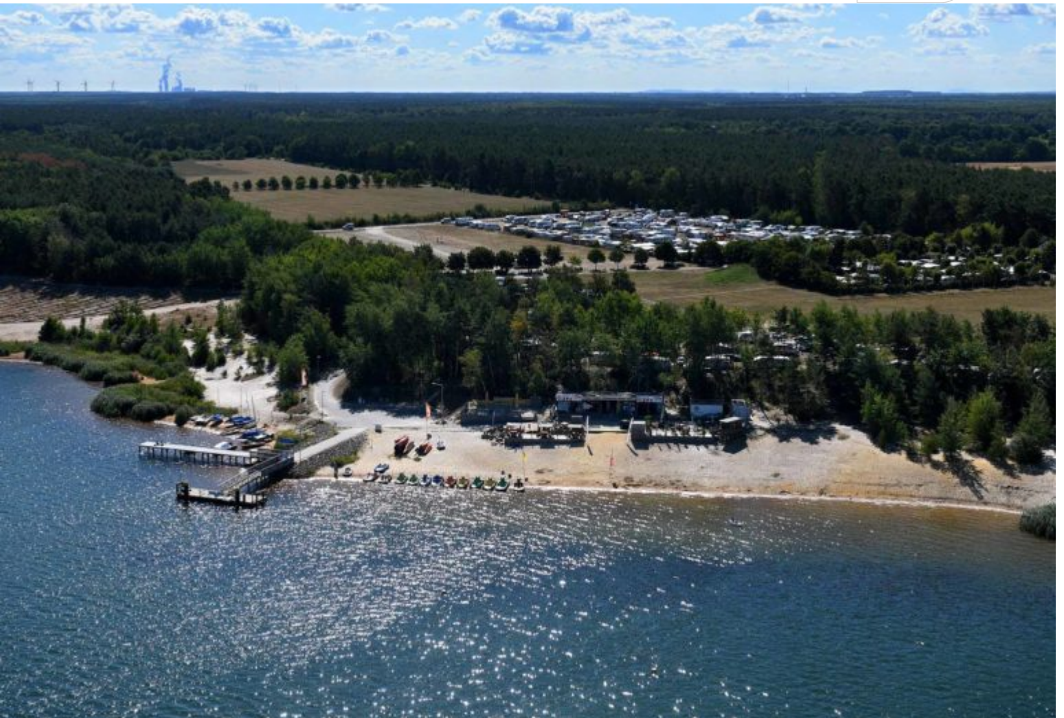
Blick auf Badestrand am Geierswalder See

Zertifikat seit 2023 audit berufundfamilie