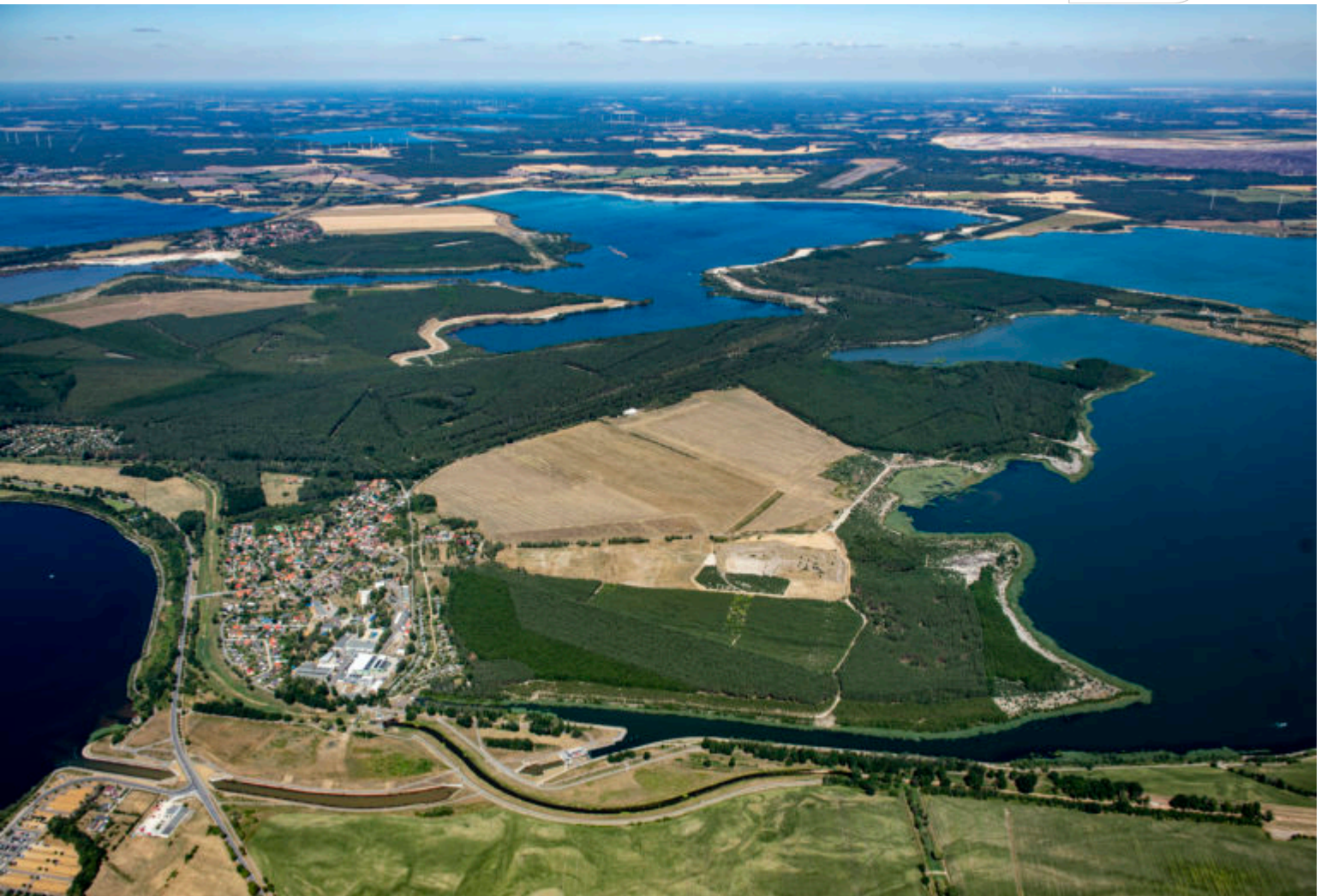
Koschener Kanal = Überleiter 12