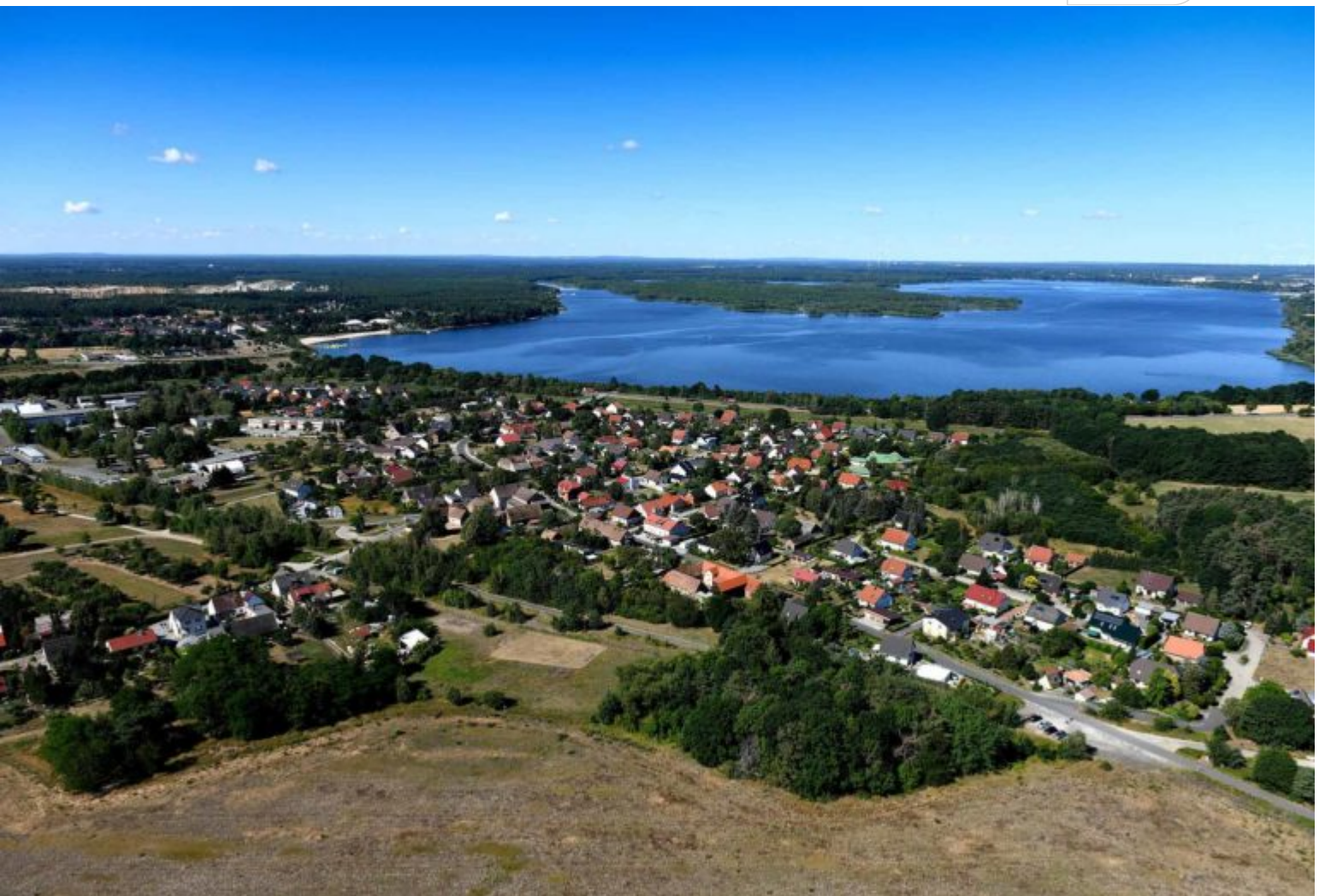
Blick aus N auf den Senftenberger See

Zertifikat seit 2023 audit berufundfamilie