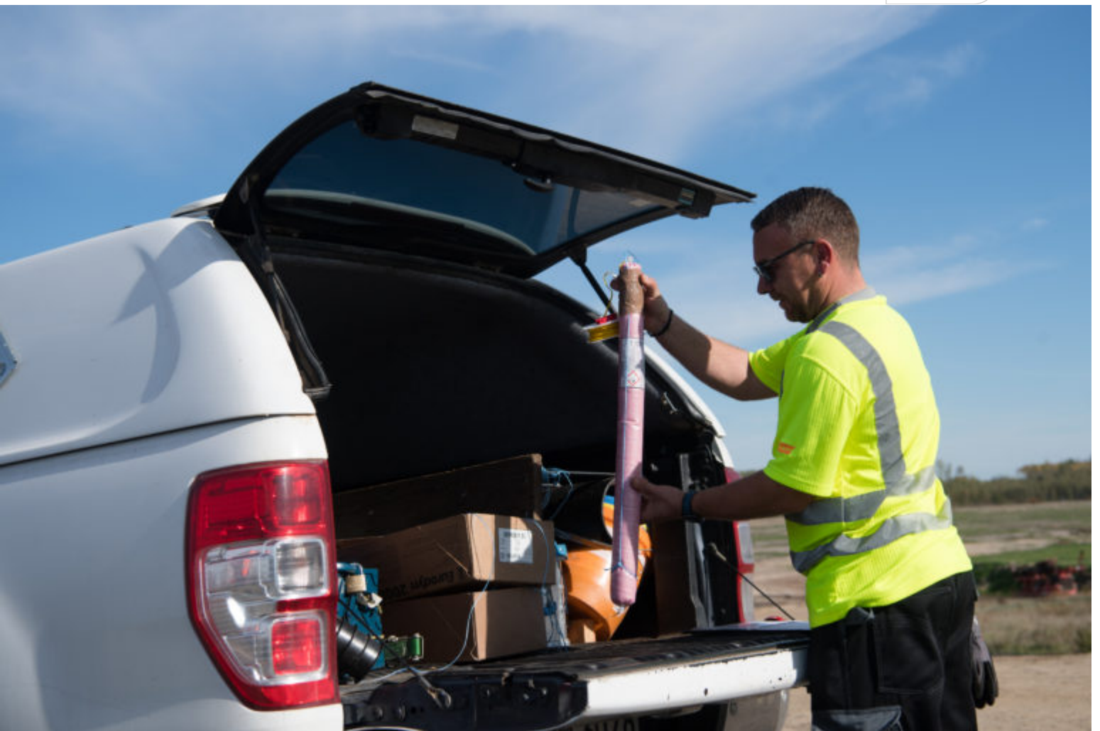
Der Plastiksprengstoff wird täglich aus Bautzen angeliefert.

Zertifikat seit 2023 audit berufundfamilie