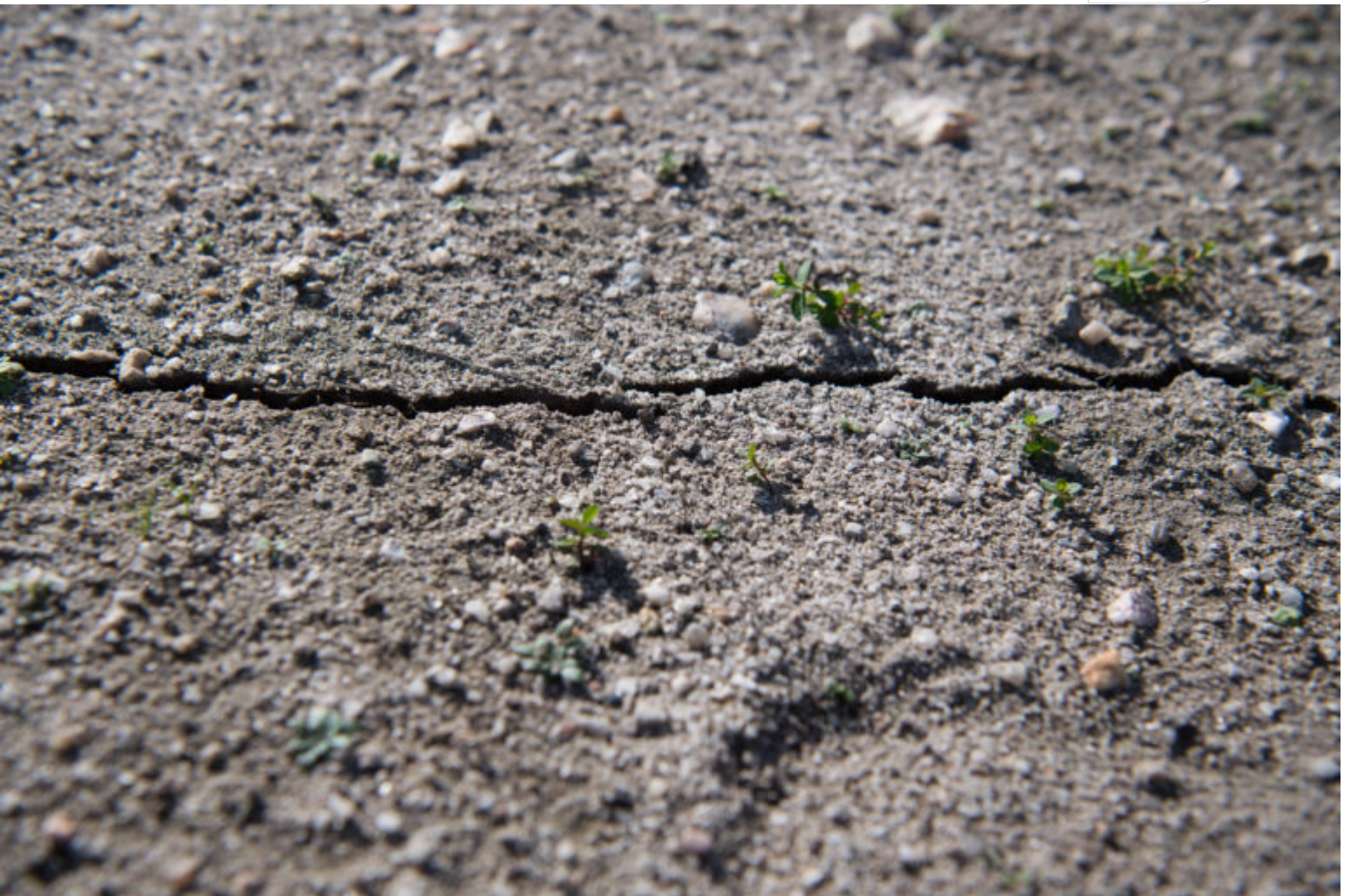
Ein durch die Erdsprengung entstandener Riss.