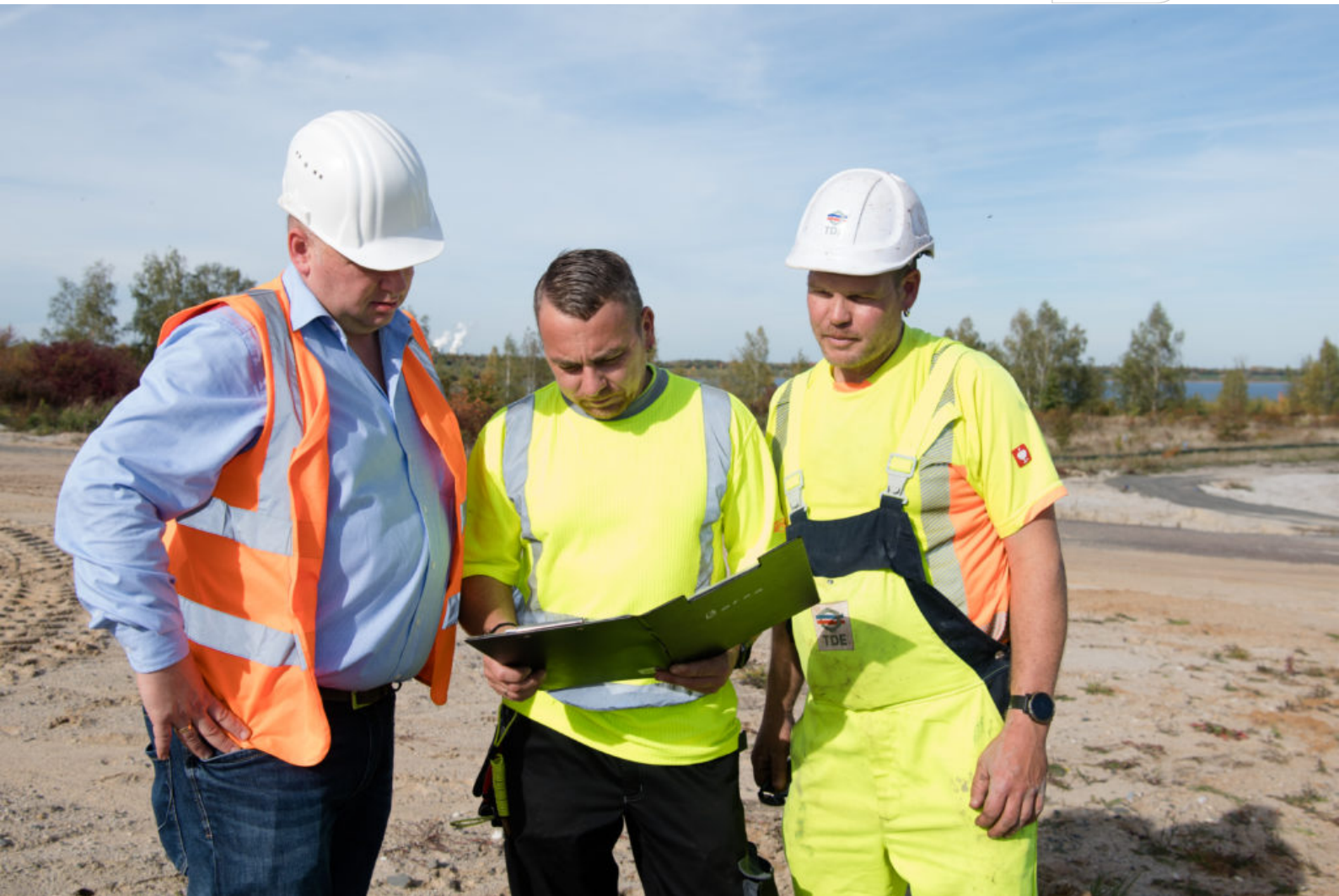
Auswertung der Sprengarbeiten zwischen TDE und LMBV.

Zertifikat seit 2023 audit berufundfamilie