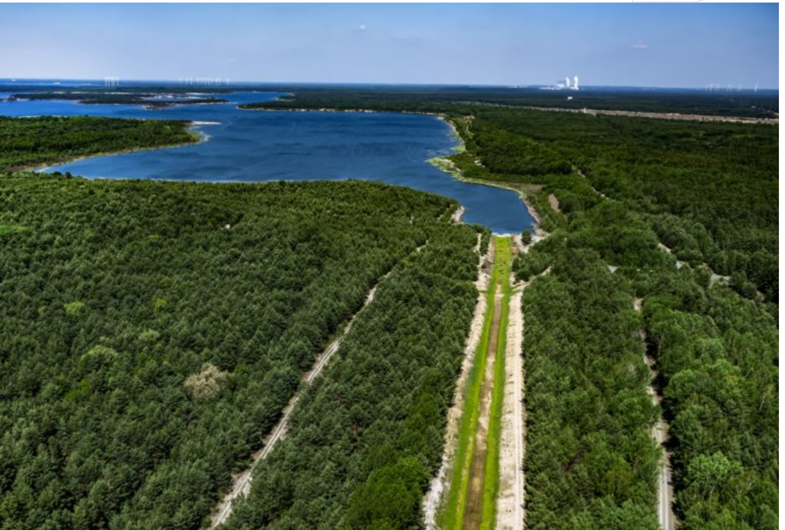
Zulauf-Anlage für den Speicher Lohsa II