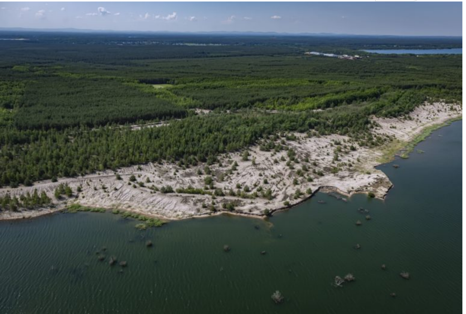
Blick von Nord nach Süd über das Ufer des LMBV-Speichers Lohsa II (2019)