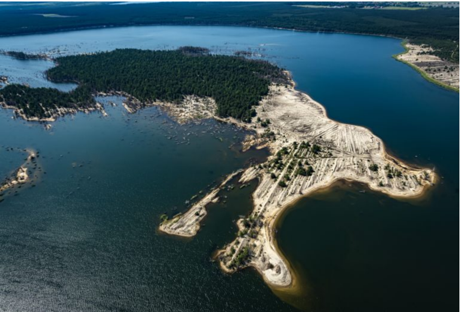
Blick über die verbliebenen ungesicherten Abschnitte im Speicher Lohsa II