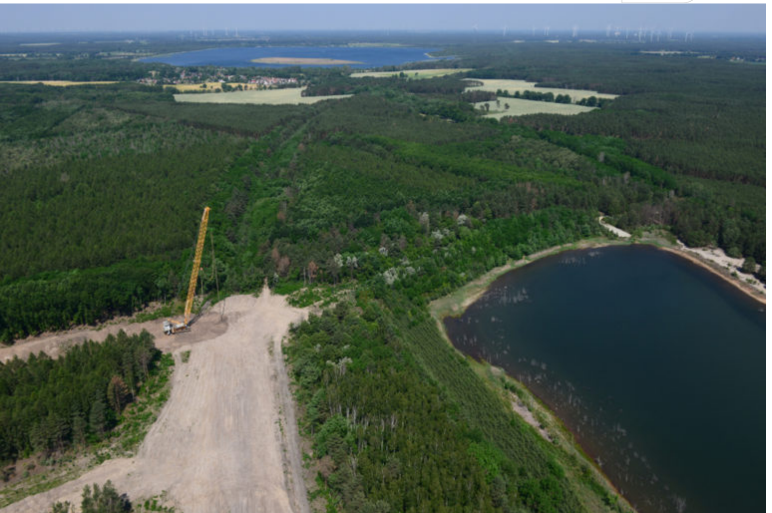
Rütteldruckverdichtung Kippe 10

Zertifikat seit 2023 audit berufundfamilie