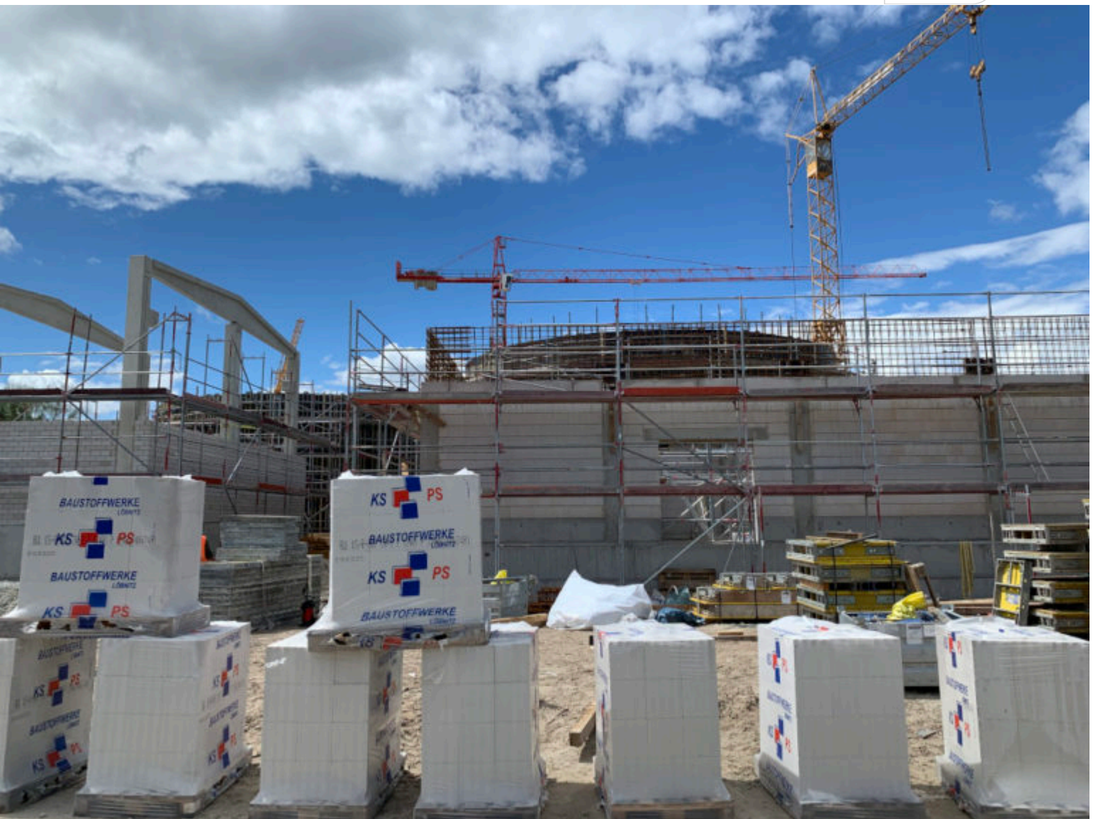
Blick auf die Baustelle

Zertifikat seit 2023 audit berufundfamilie