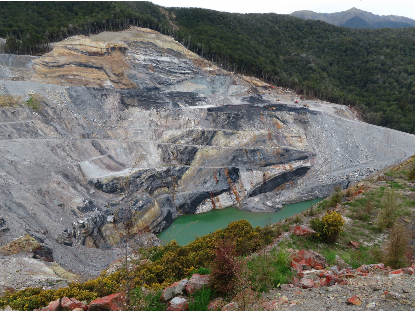
IMWA 2022: Blick in die "Echo Coal Mine", wobei der Kohleflözverlauf gut sichtbar ist