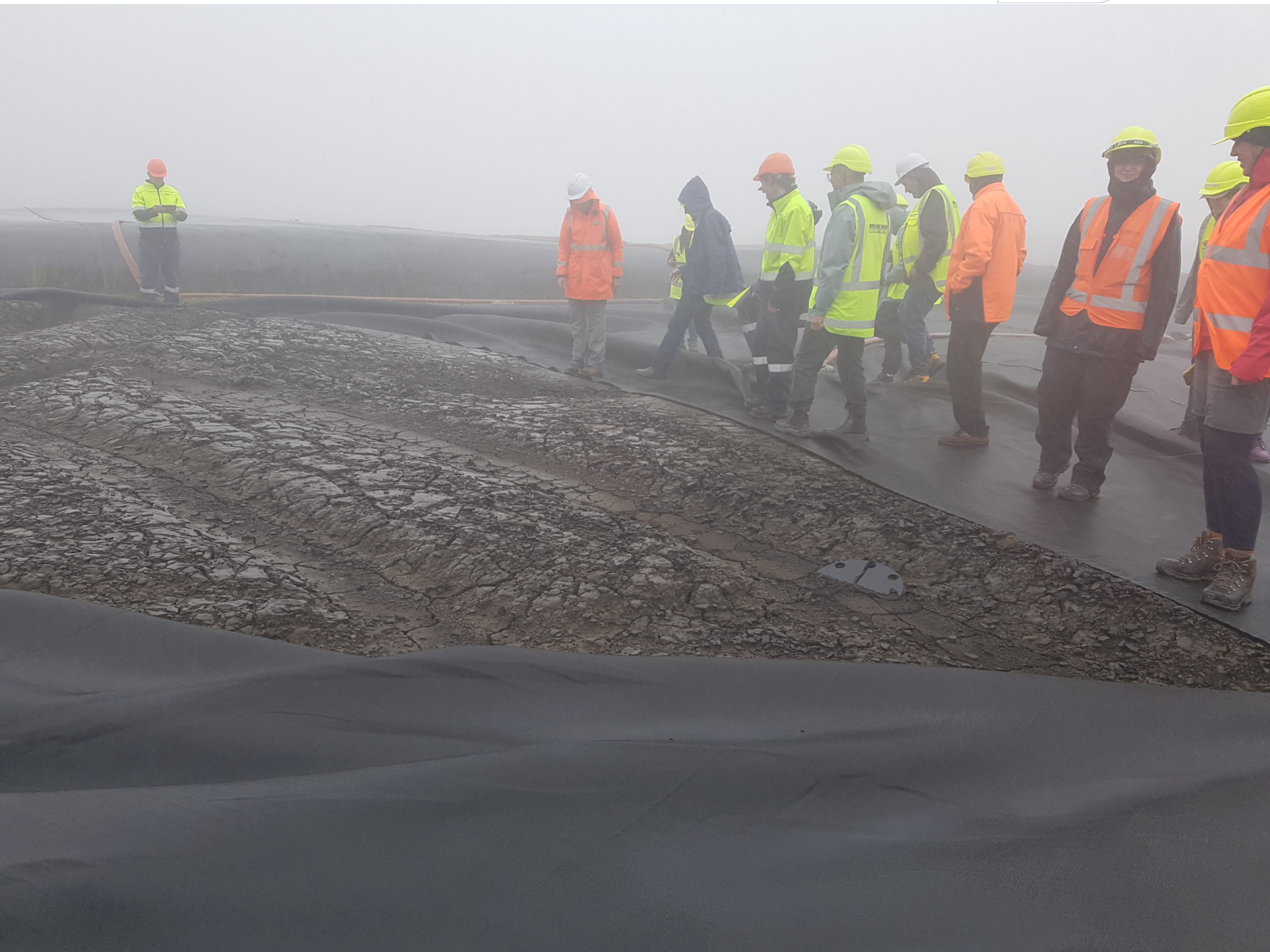
IMWA-Tourpunkt: Schlamm-trocknung in Geotubes in der "Stockton Coal Mine"