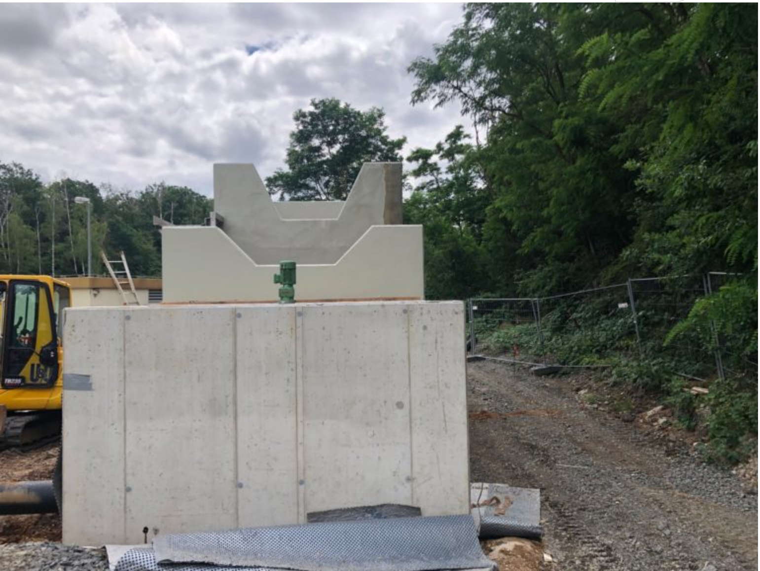
Drei-Kammer-Becken im Bau