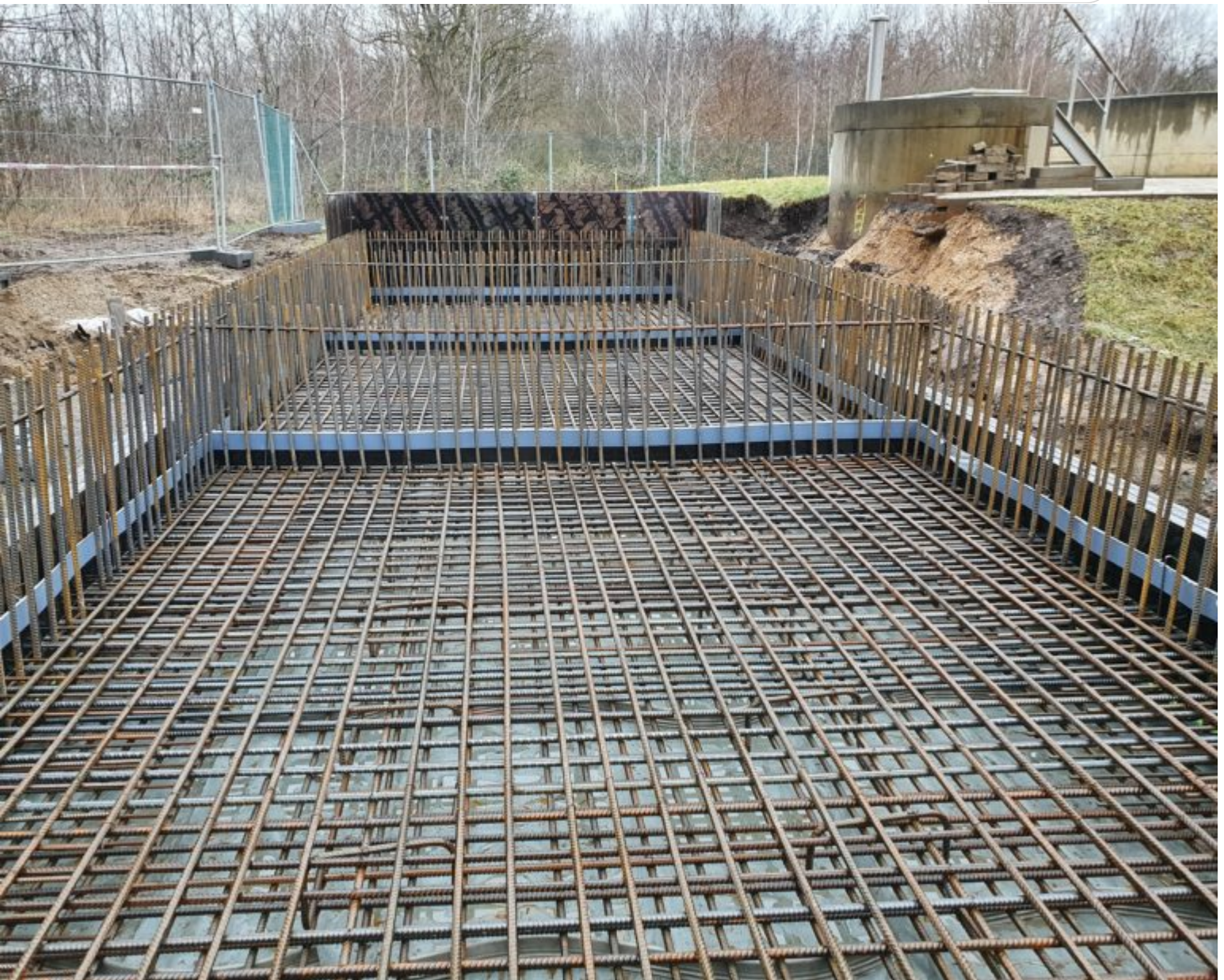
Bewehrung der Bodenplatte für das Drei-Kammer-Becken, das vor Ort gegossen wurde.

Zertifikat seit 2023 audit berufundfamilie