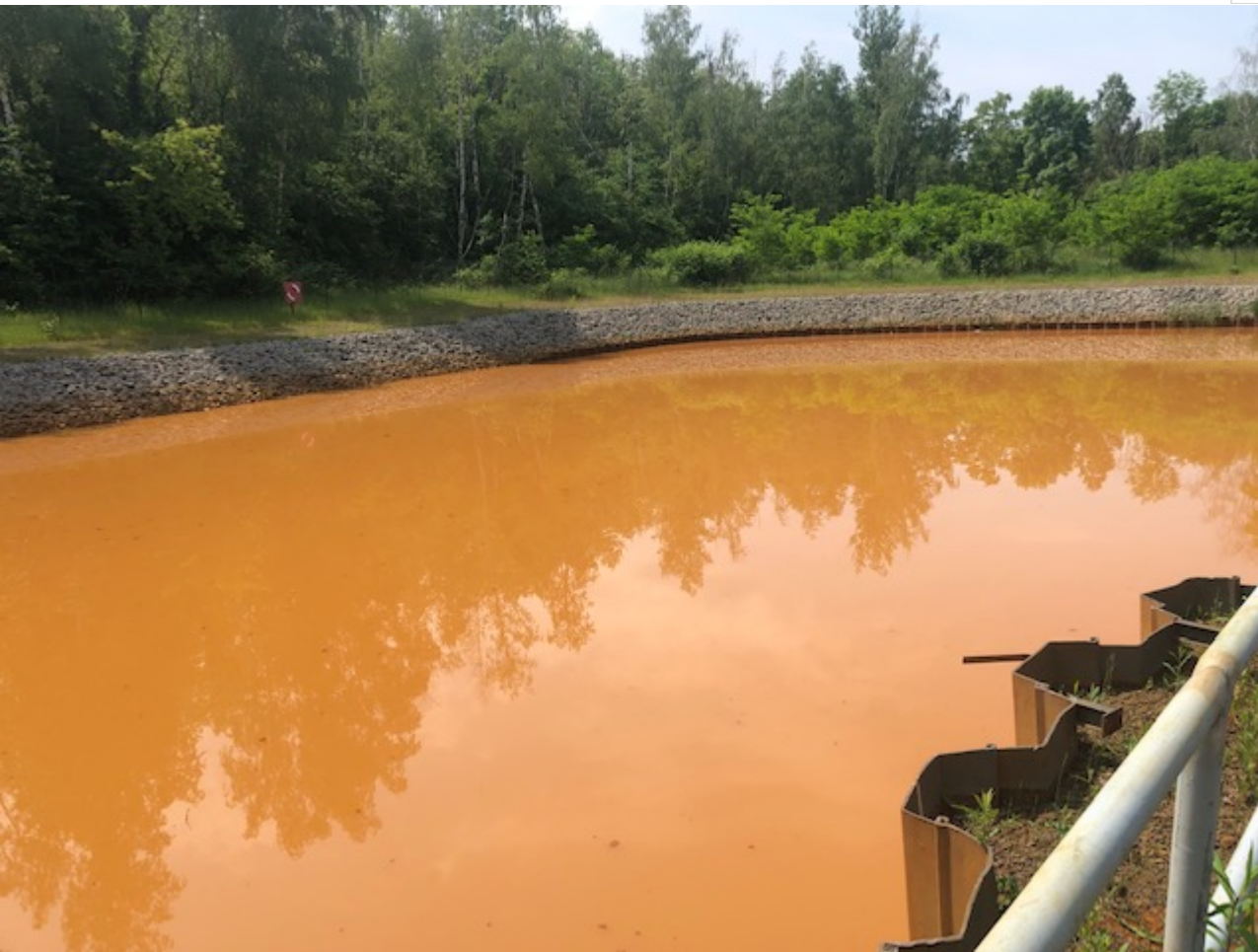
Das Regenrückhaltebecken mit stark eisenhaltigem Grund- und Niederschlagswasser.

Zertifikat seit 2023 audit berufundfamilie