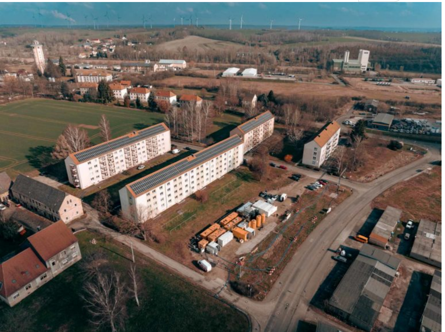
Die Anlage steht an der Talstraße

Zertifikat seit 2023 audit berufundfamilie