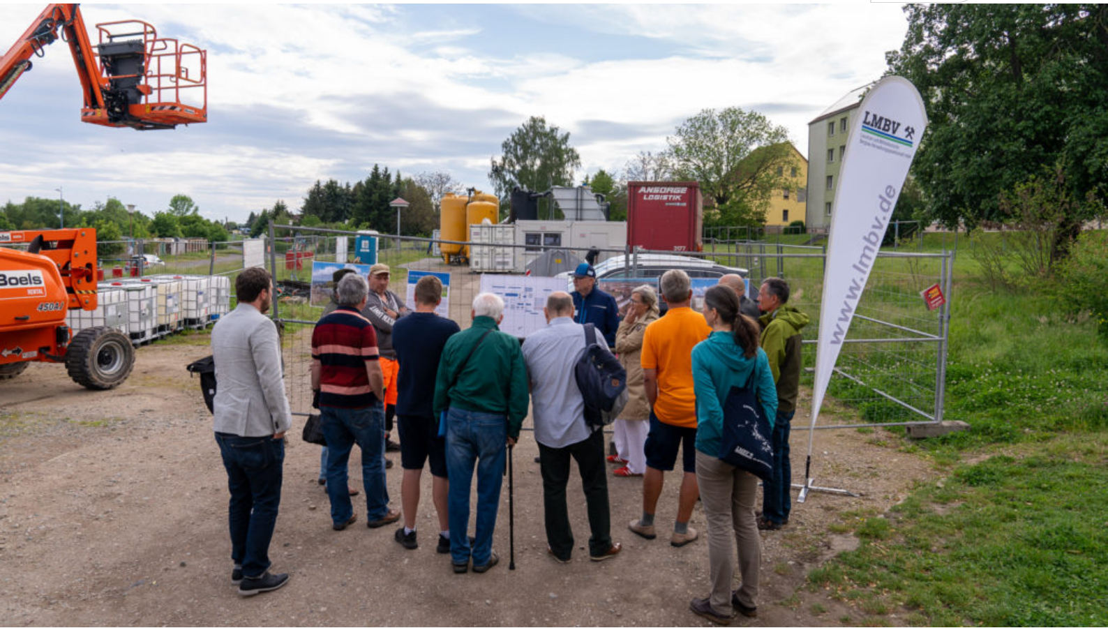
Vor an der Baustelle informierten sich interessierte Bürger über die Arbeiten