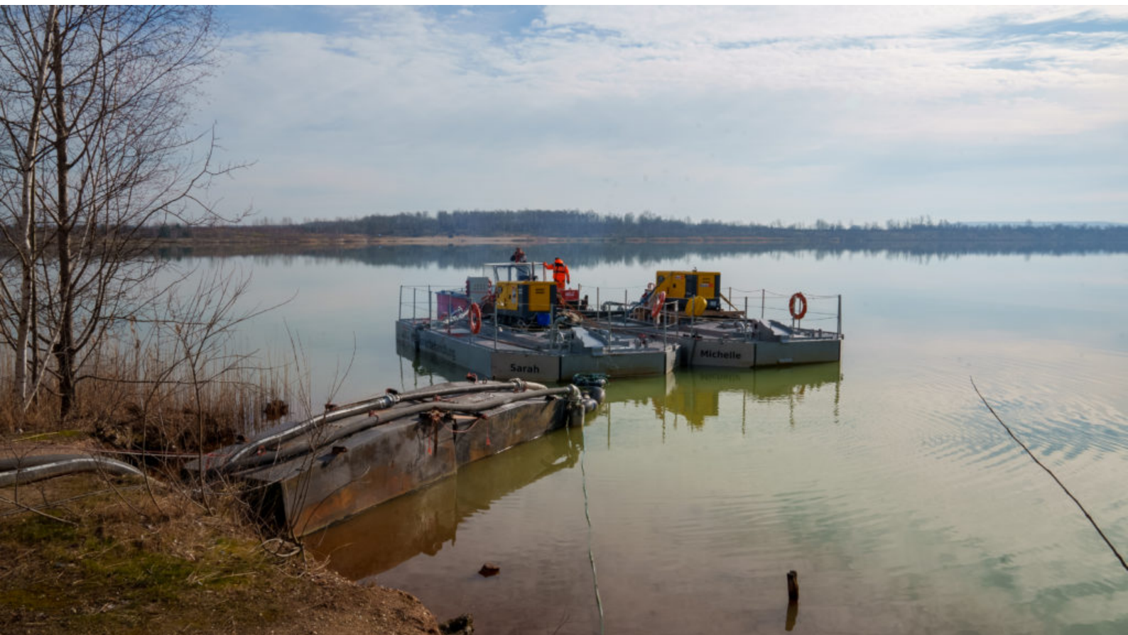
Eindrücke von der Bekalkung des Störmthaler Sees im Februar 2022

Die LMBV ist entsprechend dem Planfeststellungsbeschluss verpflichtet, den pH-Wert im Störmthaler See zwischen sechs und acht zu halten. Dazu wird das Wasser regelmäßig kontrolliert und nahezu jährlich mit Kalkmehl oder - wie in diesem Jahr - mit Kreide behandelt, die einen sehr guten Wirkungsgrad hat. Die letzte Gewässerbehandlung fand im Frühling 2022 statt.