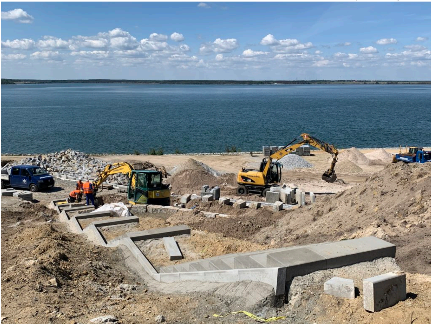
Postkarten-Wetter in der Lausitz

Zertifikat seit 2023 audit berufundfamilie