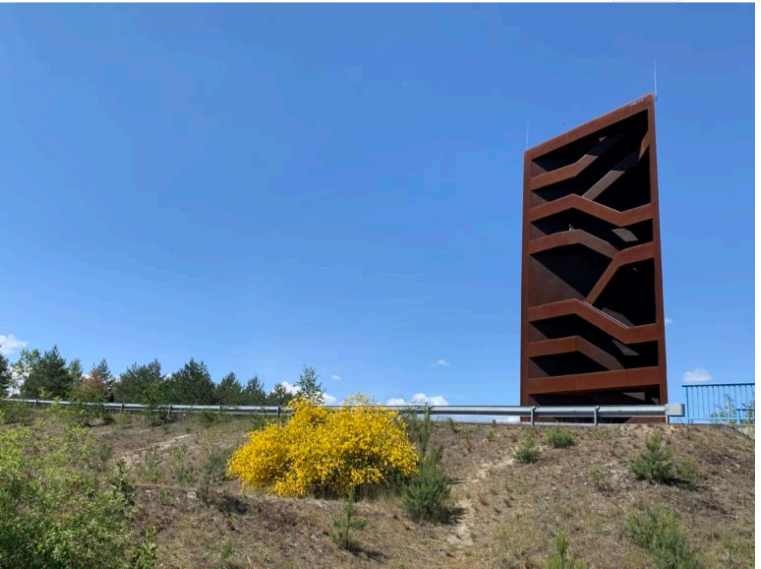
Rostiger Nagel im Mai 2020