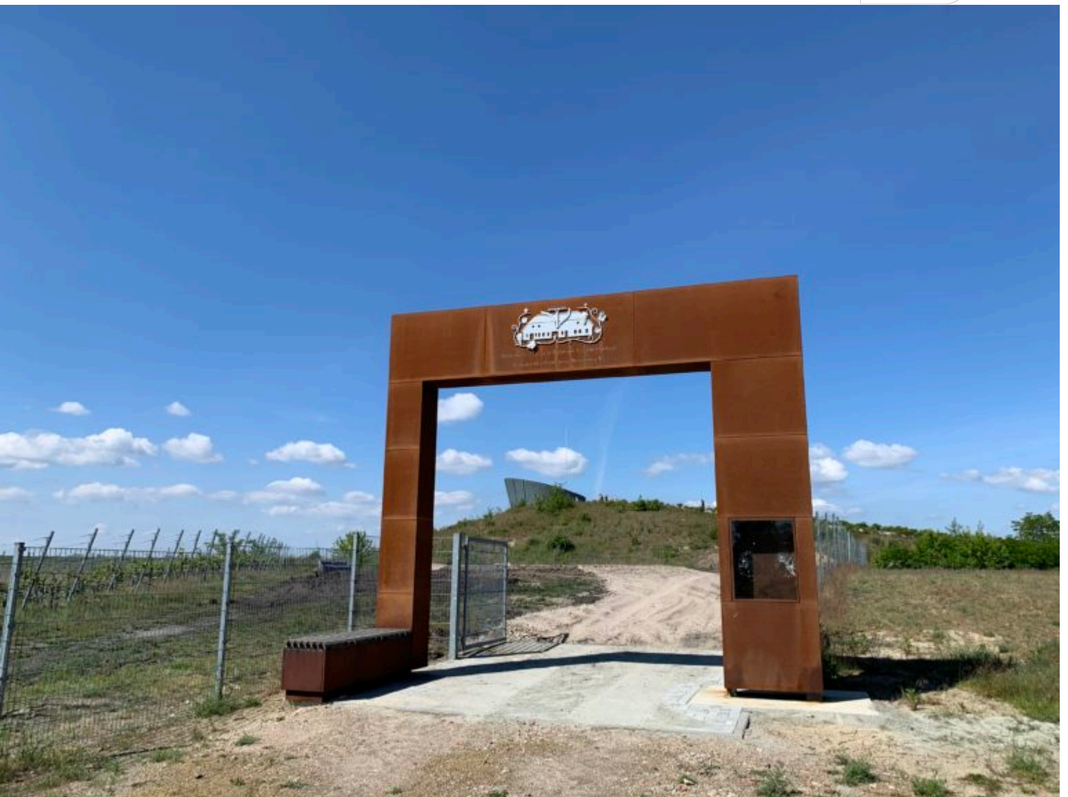
Weinberg-Tor am Großräschener See an der Victoriahoehe

Zertifikat seit 2023 audit berufundfamilie