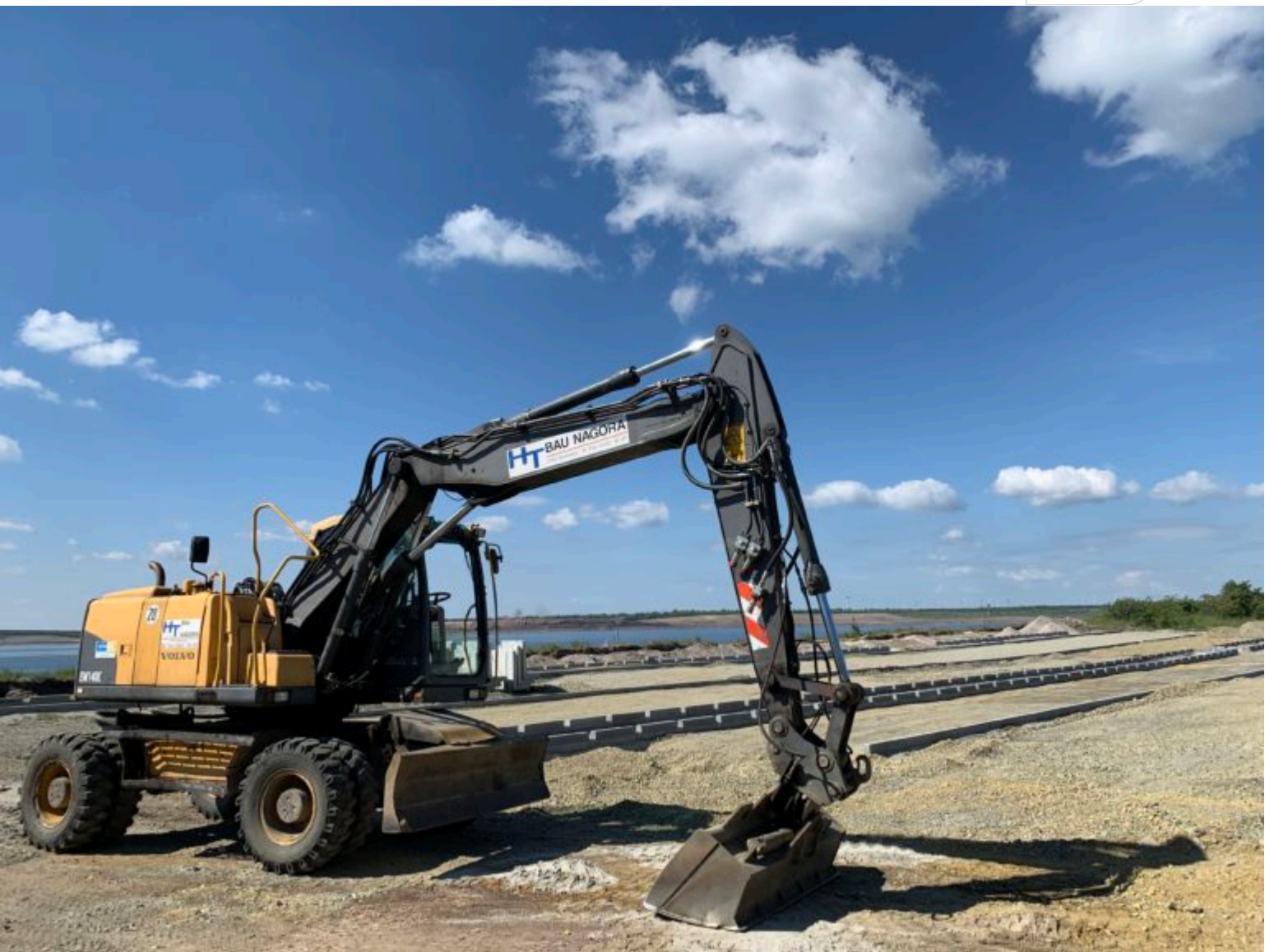
Parkplatzbau für den künftigen Stadtstrand am Großräschener See

Zertifikat seit 2023 audit berufundfamilie