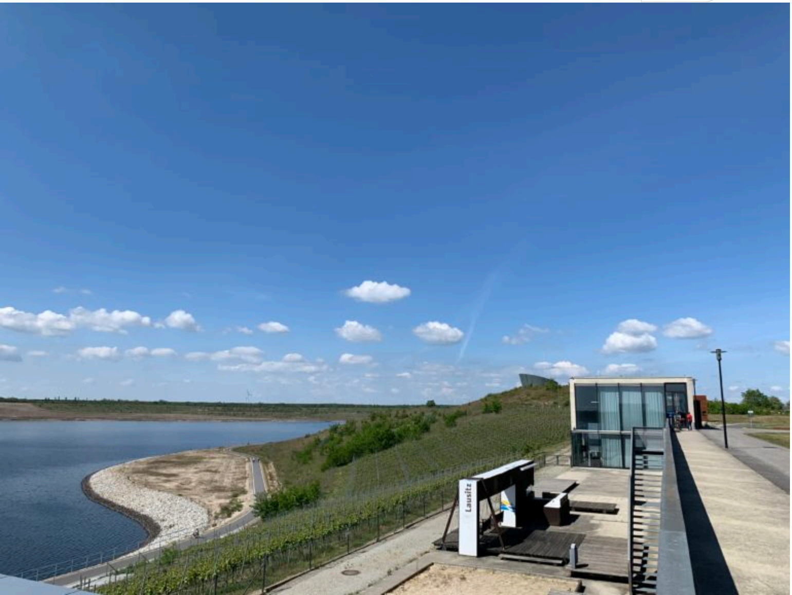
Blick über den Weinberg zur Victoriahöhe am Großräschener See