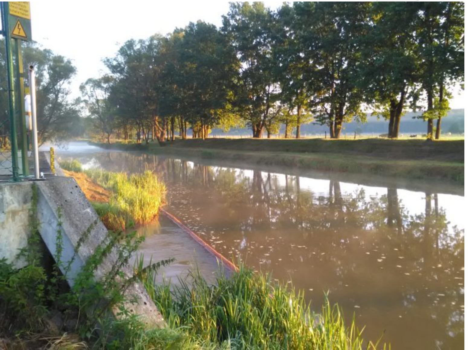
Symbolfoto: LMBV-Abnahmebauwerk an der Spree bei Spreewitz

Zertifikat seit 2023 audit berufundfamilie