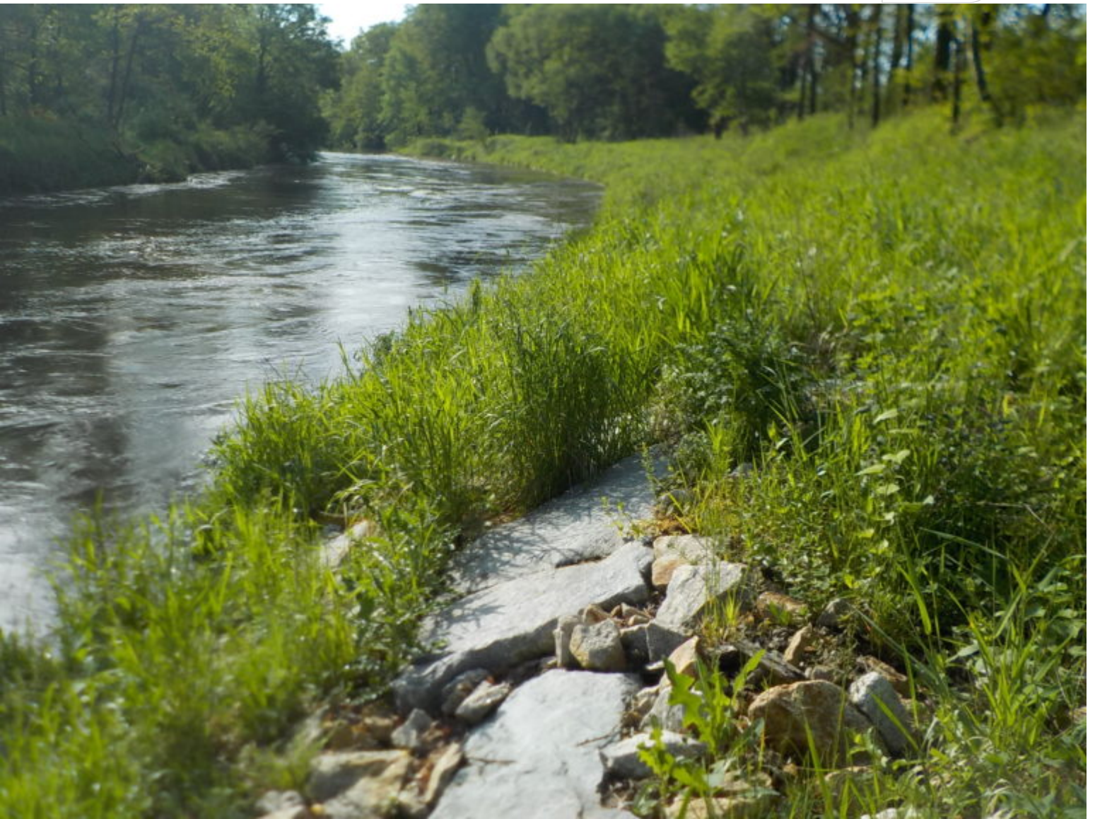
Lausitzer Neiße bei Steinbach mit höherem Durchfluss