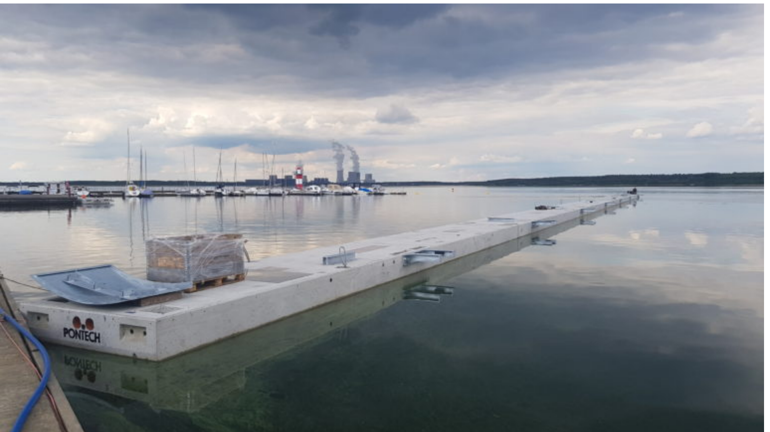
FHG: Zusätzlicher Steg der Investoren an Klittener Marina installiert