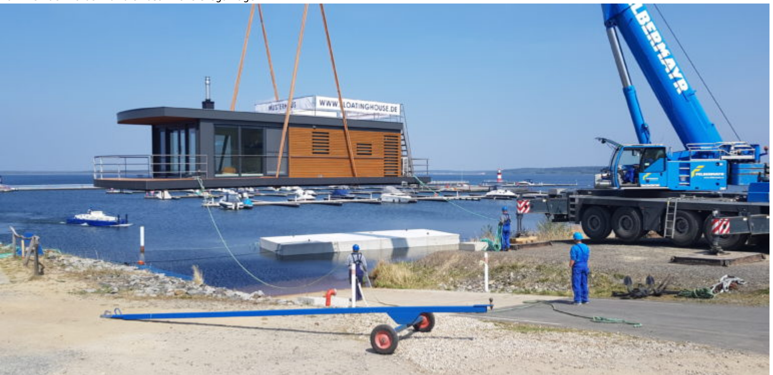
Einkranen des Musterhauses 2019