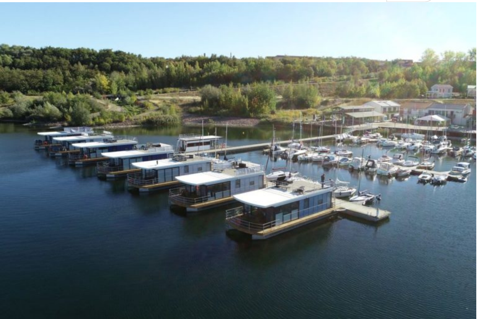
FHG: Beispiel für Schwimmende Häuser auf einem Bergbaufolgesee

Zertifikat seit 2023 audit berufundfamilie