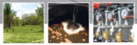
Innovative Grundwasserreinigung am Altstandort Kupferhammer