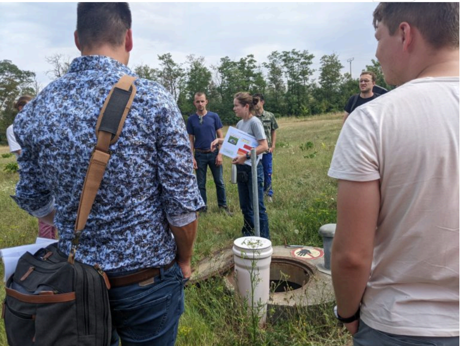
Die Belastung des Grundwassers mit Schadstoffen ließ sich eindrucksvoll an einem geöffnetem Brunnen "erschnuppern"