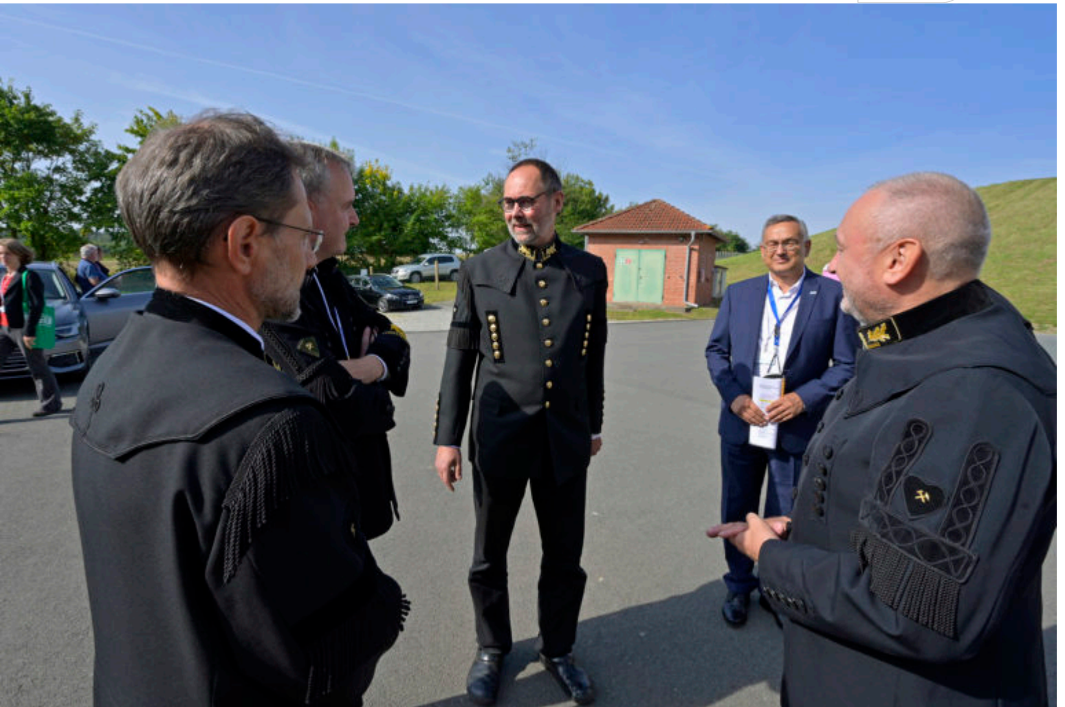
Begrüßung an der Steuerungswarte