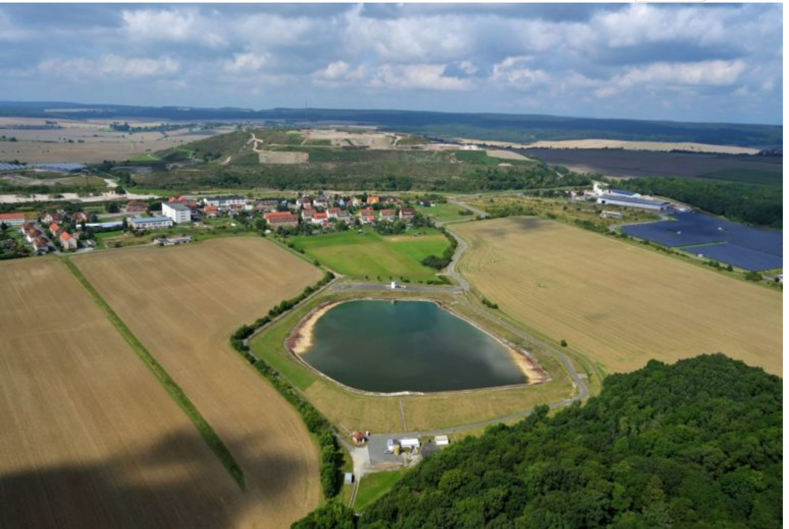
Menteroda Rückstandshalde Laugenbecken