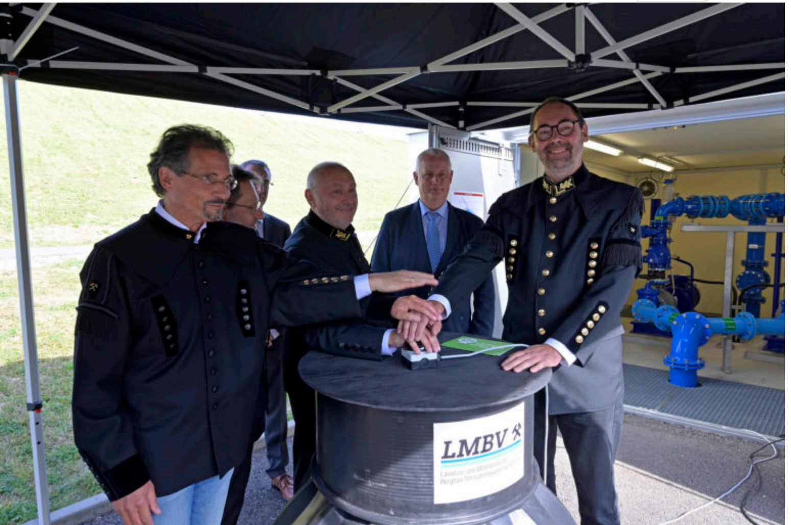
Wasser marsch für die Leitung an der Startknopfanlage

Zertifikat seit 2023 audit berufundfamilie