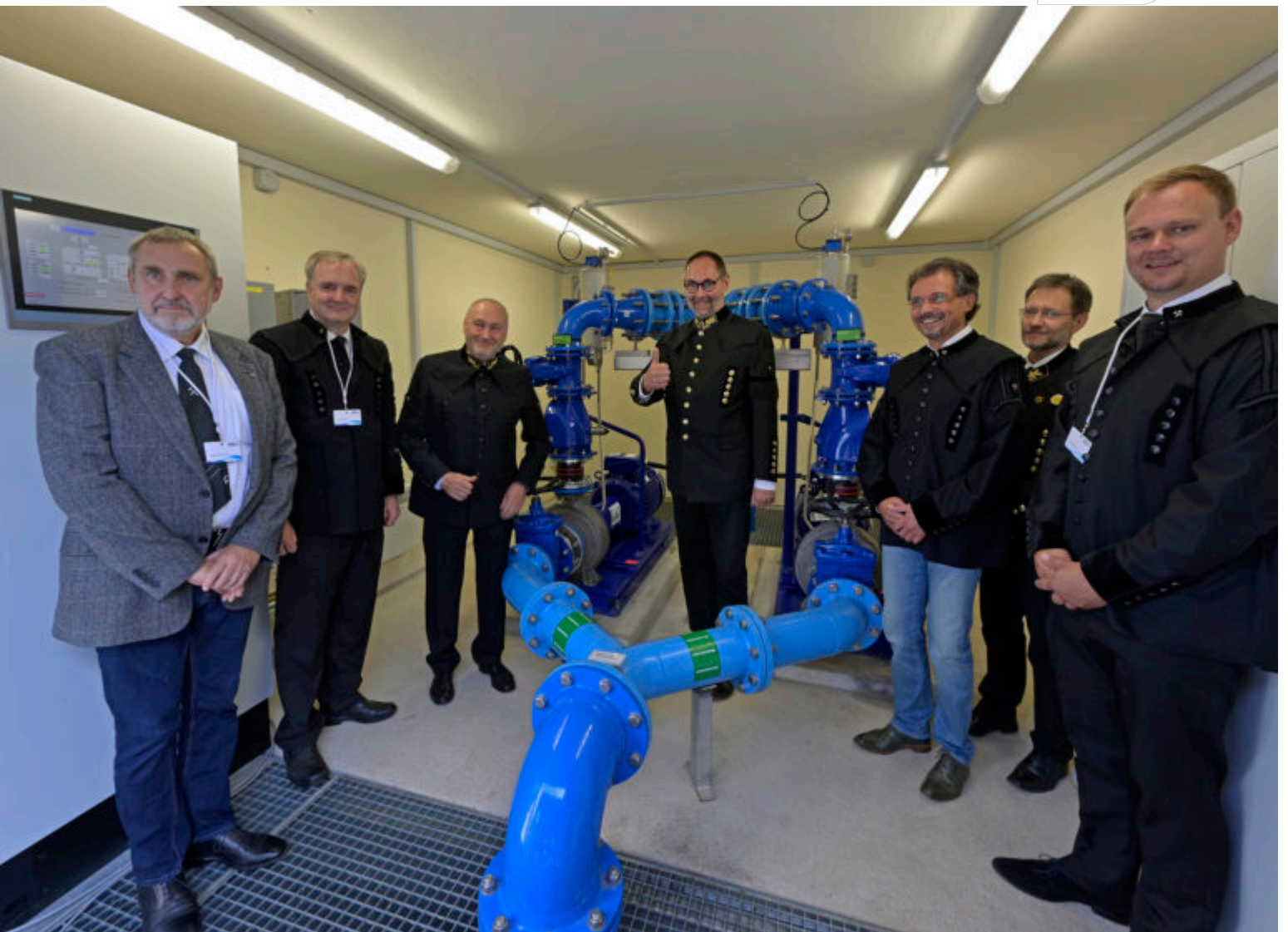
Besichtigung der Pumpanlage

Zertifikat seit 2023 audit berufundfamilie