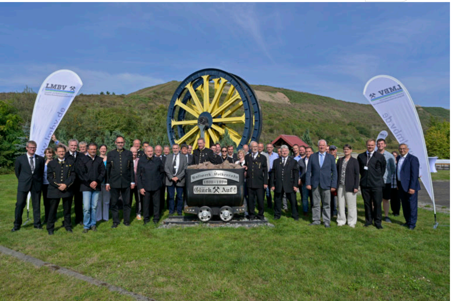
Die Inbetriebnahme der neuen Laugenrohrleitung am Standort Menteroda der LMBV-KSE. Foto: 2. September 2021.

Zertifikat seit 2023 audit berufundfamilie