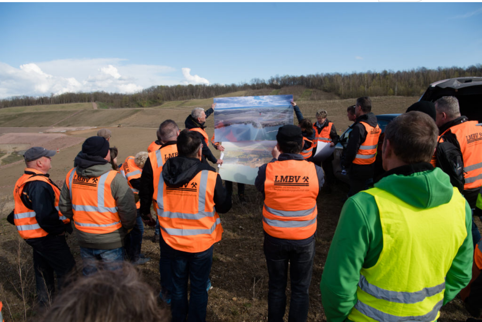
Impressionen von der Veranstaltung

Zertifikat seit 2023 audit berufundfamilie