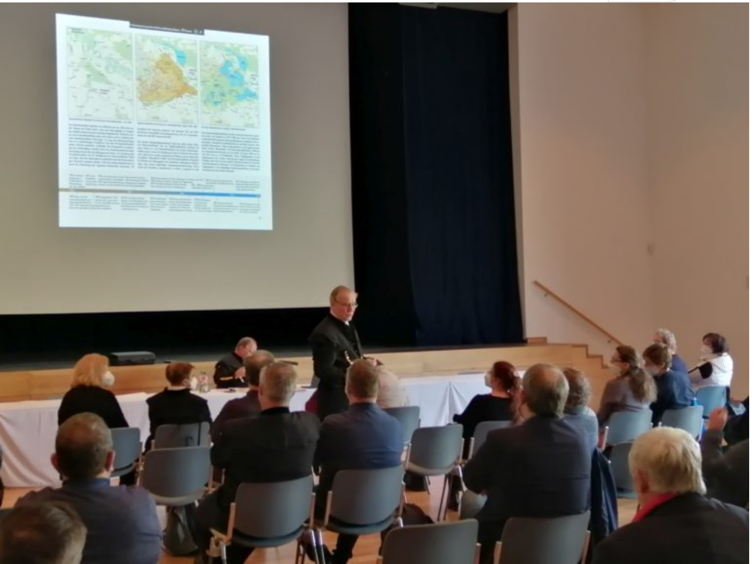
Beitrag von Bernd-Stephan Tienz