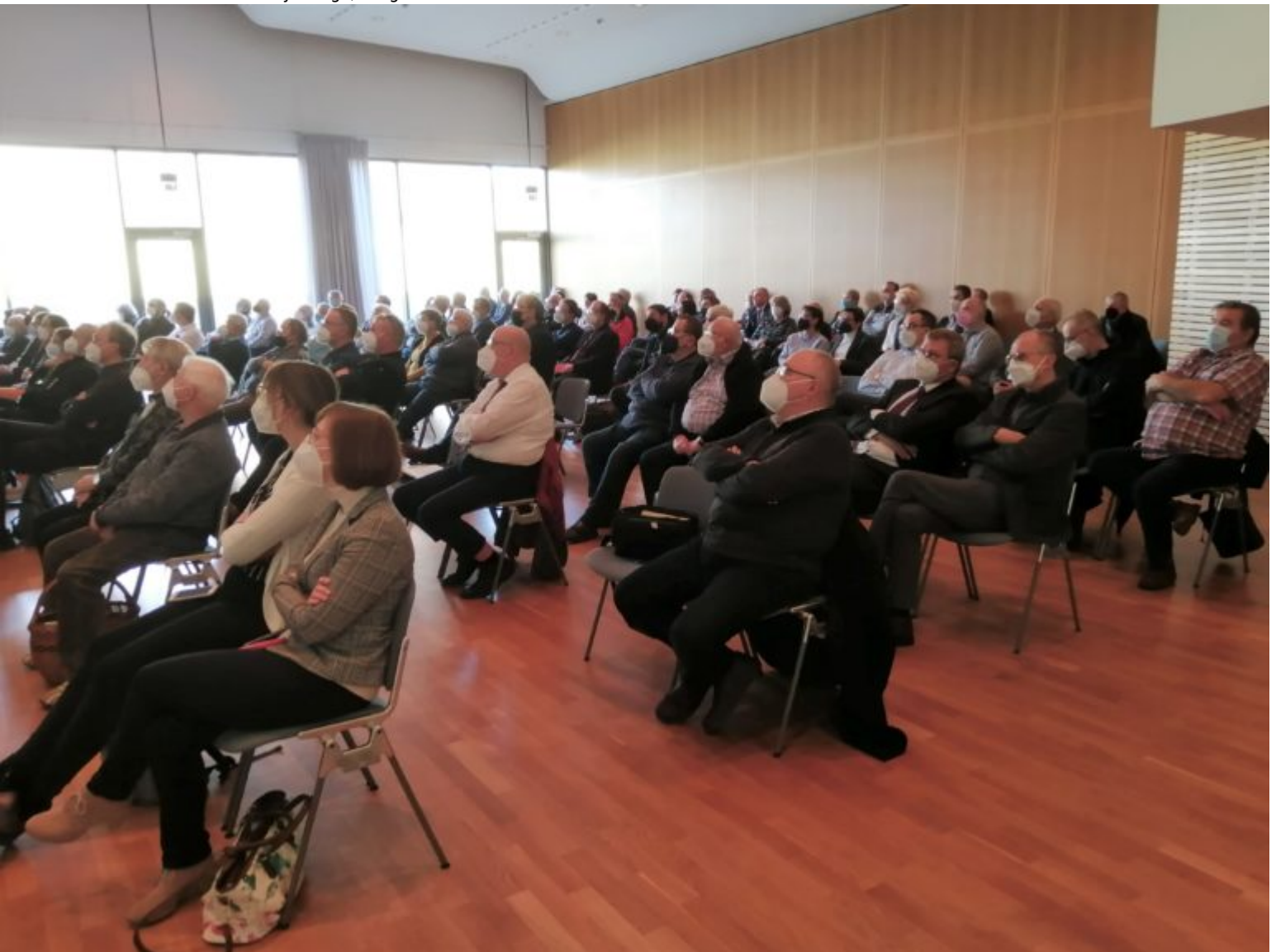
Auditorium der Veranstaltung