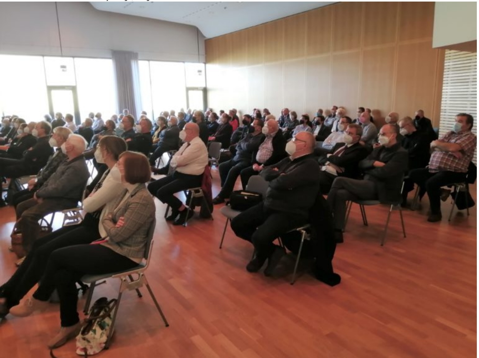
Auditorium der Veranstaltung