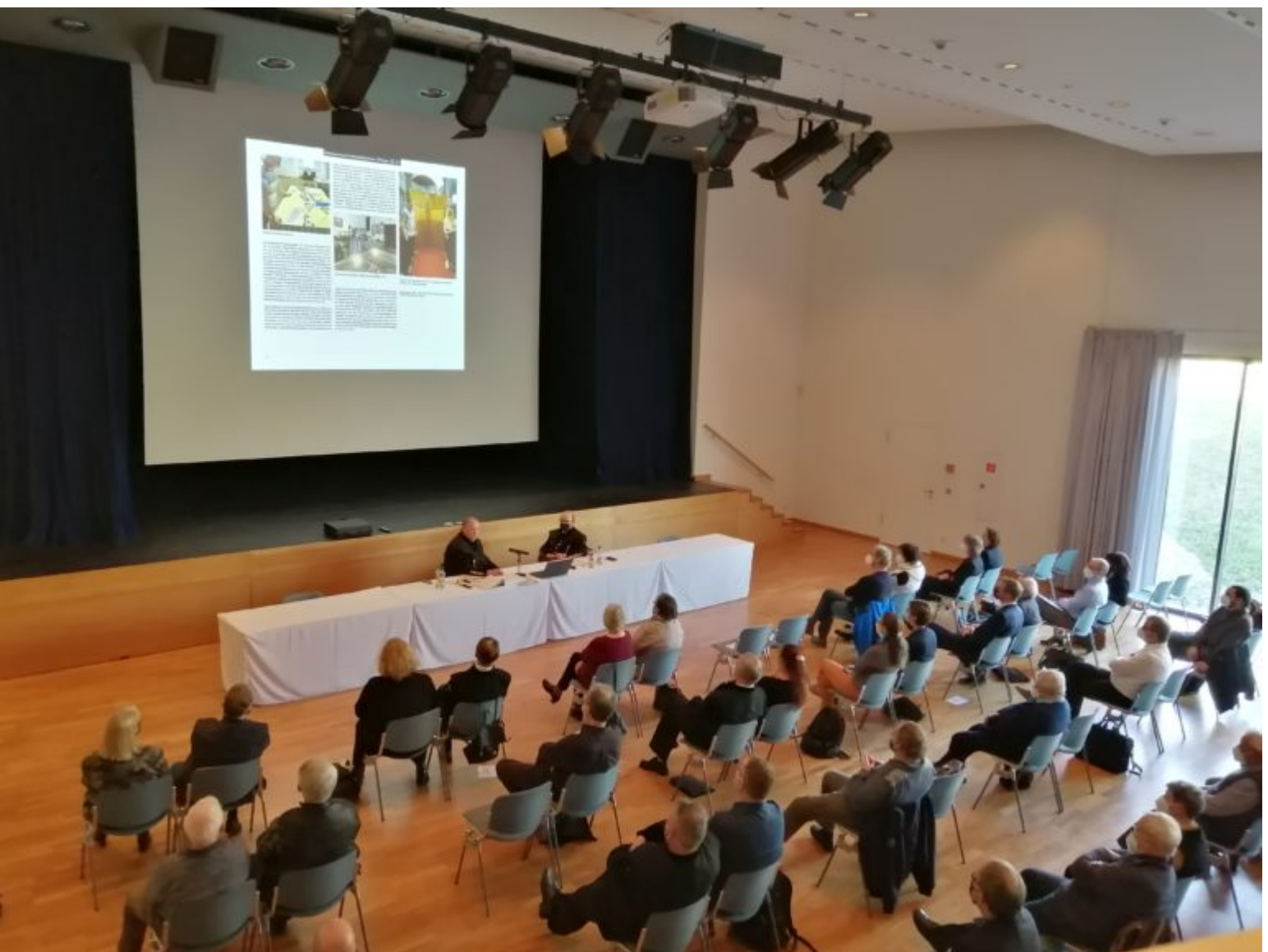
Buchpremiere im Bürgerhaus Hohenmölsen