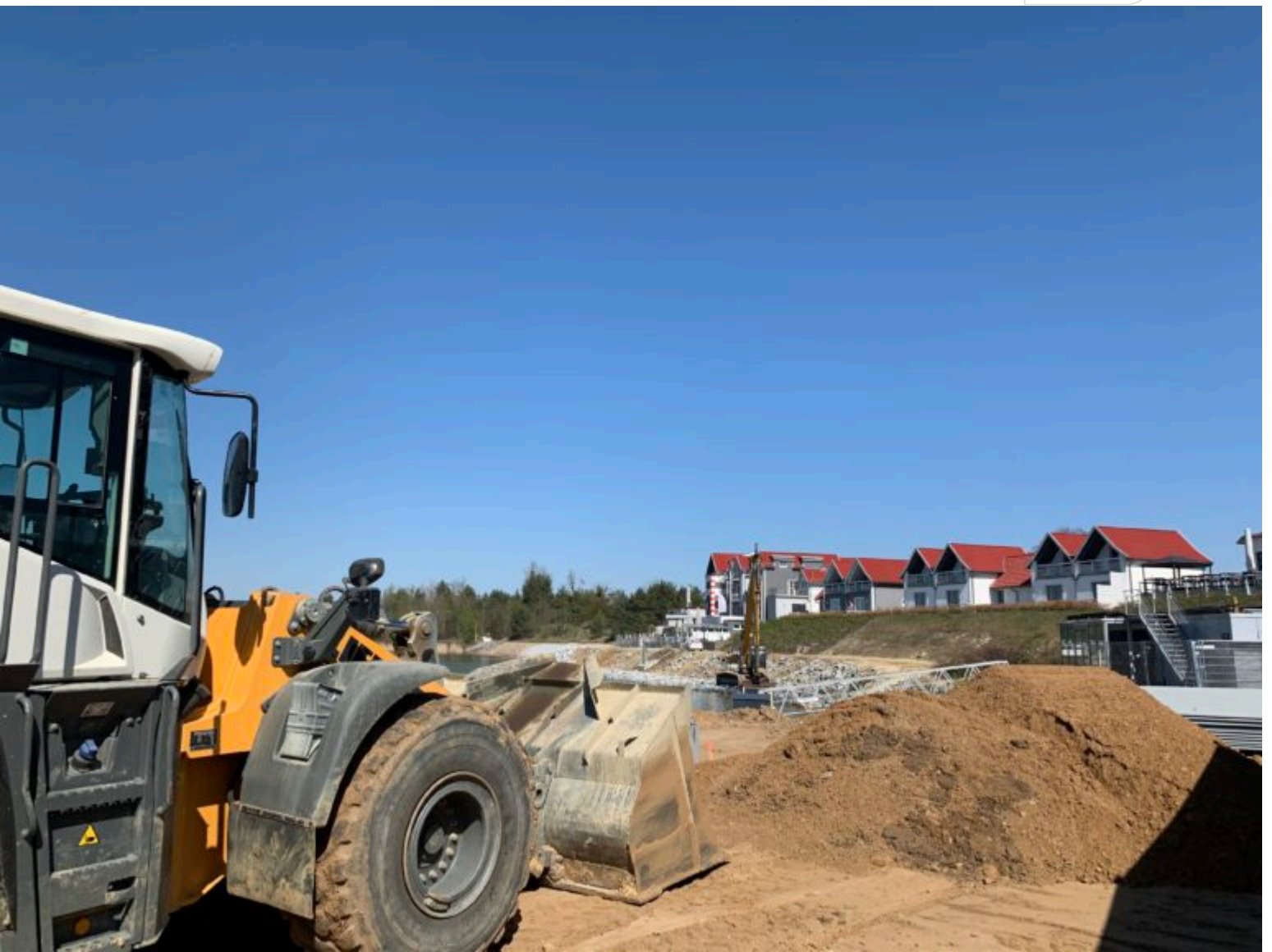
Blick auf den teilweise bereits mit Wasserbausteinen gesicherten Uferabschnitt

Zertifikat seit 2023 audit berufundfamilie