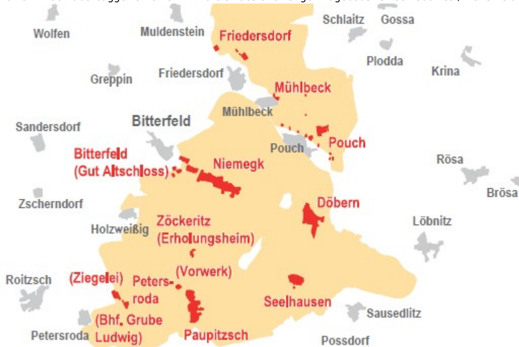
Karte mit den überbaggerten Orten im Bereich des ehemaligen Tagebaus Goitsche Impressionen von der Ausstellungseröffnung