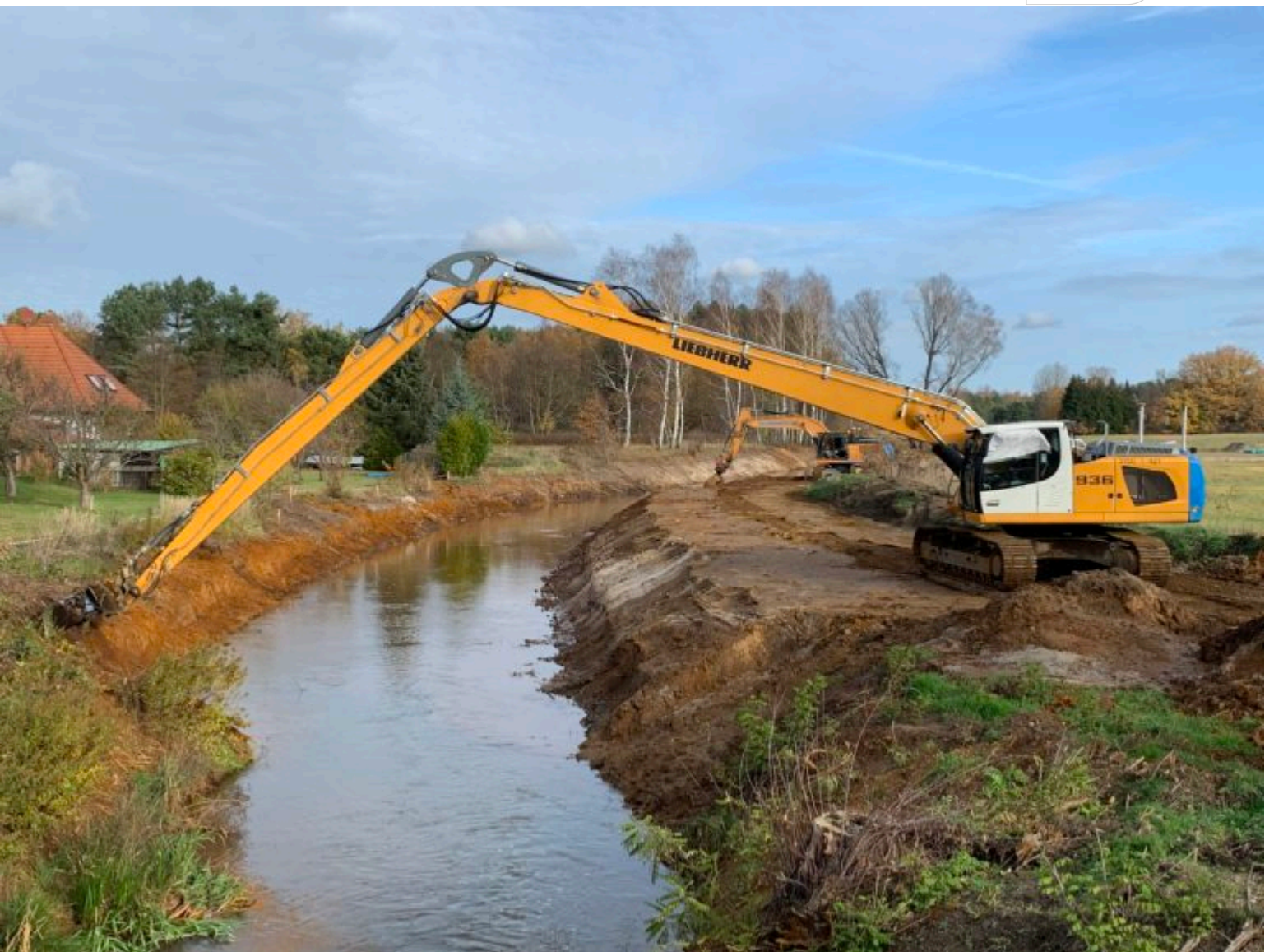
Blick von der Brücke: Ausbau der Kleinen Spree in Burgneudorf Mitte Nov. 2020

Zertifikat seit 2023 audit berufundfamilie