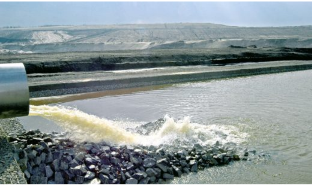
Flutungsleitung zum Großräschener See (2007)

/*! elementor - v3.23.0 - 05-08-2024 */ .elementor-widget-image{text-align:center}.elementor-widget-image a{display:inline-block}.elementor-widget-image a img[src$=".svg"]{width:48px}.elementor-widget-image img{vertical-align:middle;display:inline-block}