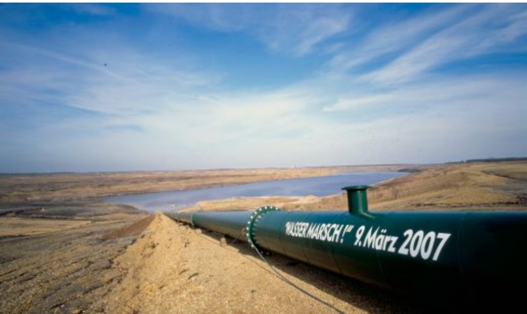
Flutungsleitung zum Zwenkauer See (2007)