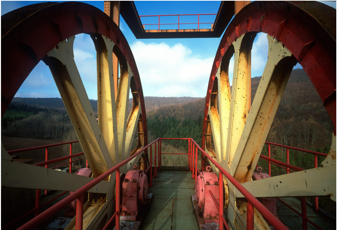
Seilscheiben auf dem Fördergerüst des Bergwerks Sollstedt im Kali-Südharzrevier