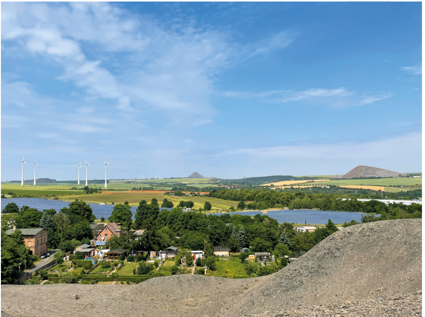
Blick von Halde Eisleben

Zertifikat seit 2023 audit berufsfamilie