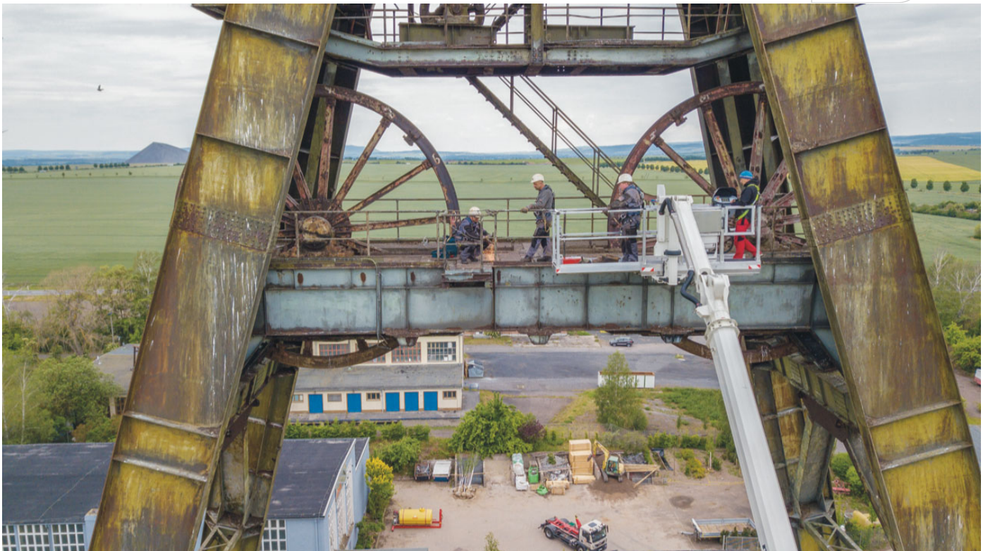
Fördergerüst in Nienstedt

Zertifikat seit 2023 audit berufundfamilie