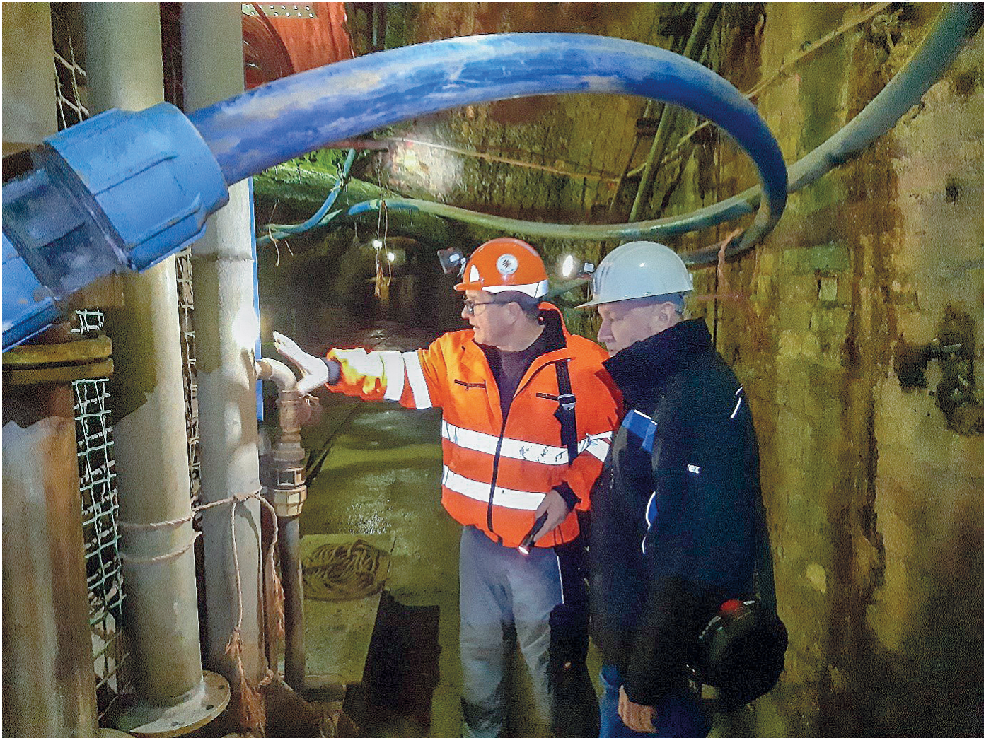
Begehung des Zentralschachtes im Bergwerk Elbingerode

Zertifikat seit 2023 audit berufundfamilie