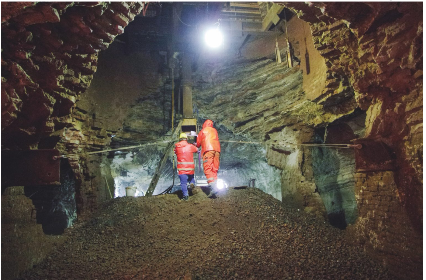
Verwahrung von Schächten im Bergwerk Bischofferode, 2015

Zertifikat seit 2023 audit berufundfamilie