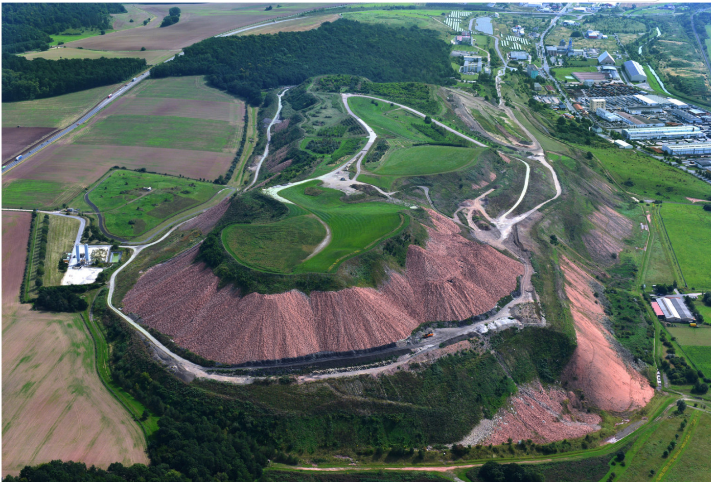
Halde in Sondershausen

Zertifikat seit 2023 audit berufundfamilie