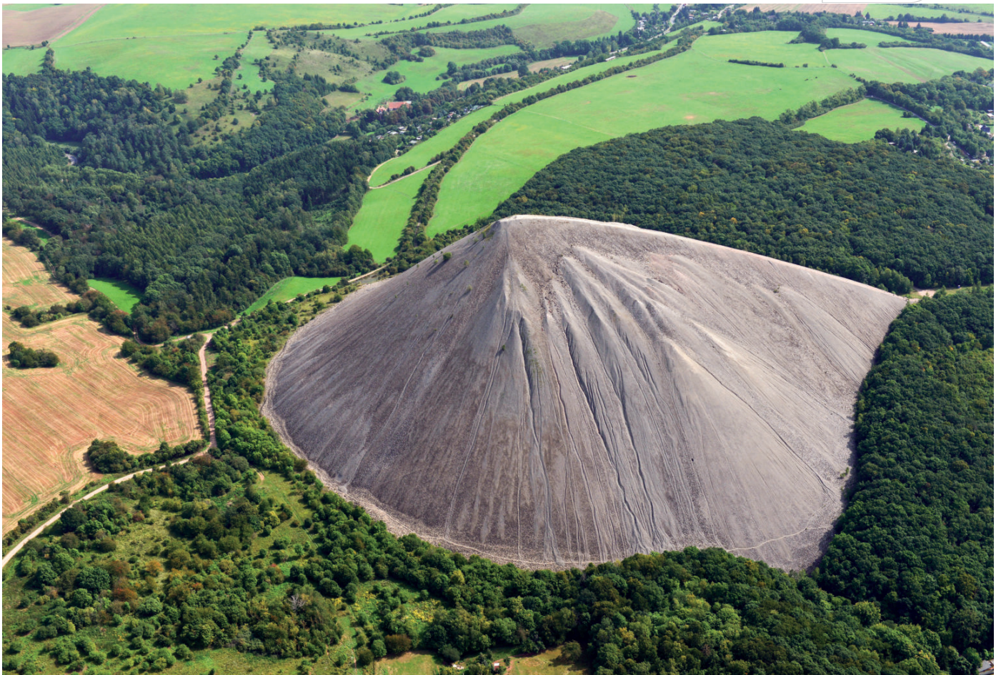
Halde Hohe Linde in Sangerhausen