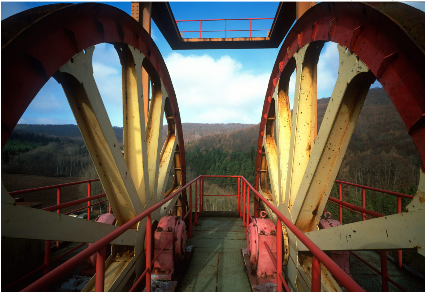
Seilscheiben auf dem Fördergerüst des Bergwerks Sollstedt im Kali-Südharzrevier

Zertifikat seit 2023 audit berufundfamilie