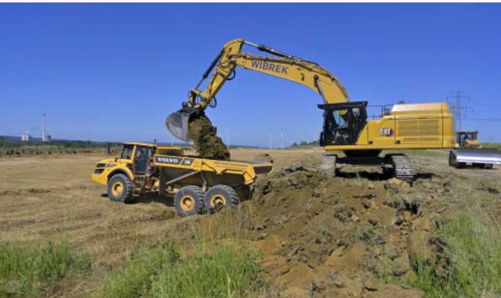
Massenbewegung in einem Sanierungstagebau der LMBV