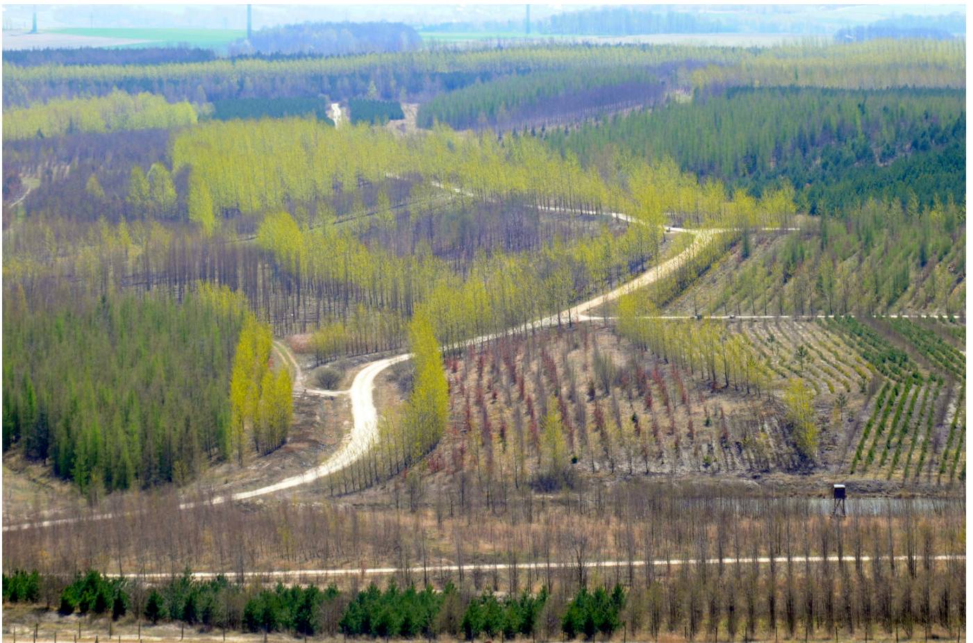
Aufgeforstete Fläche in Berzdorf

In den ostdeutschen Braunkohlenrevieren kommt der forstlichen Rekultivierung eine Schlüsselstellung für die nachbergbauliche Landschaftsentwicklung zu.