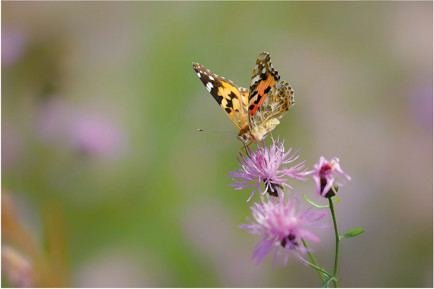
Distelfalter in einer Bergbaufolgelandschaft