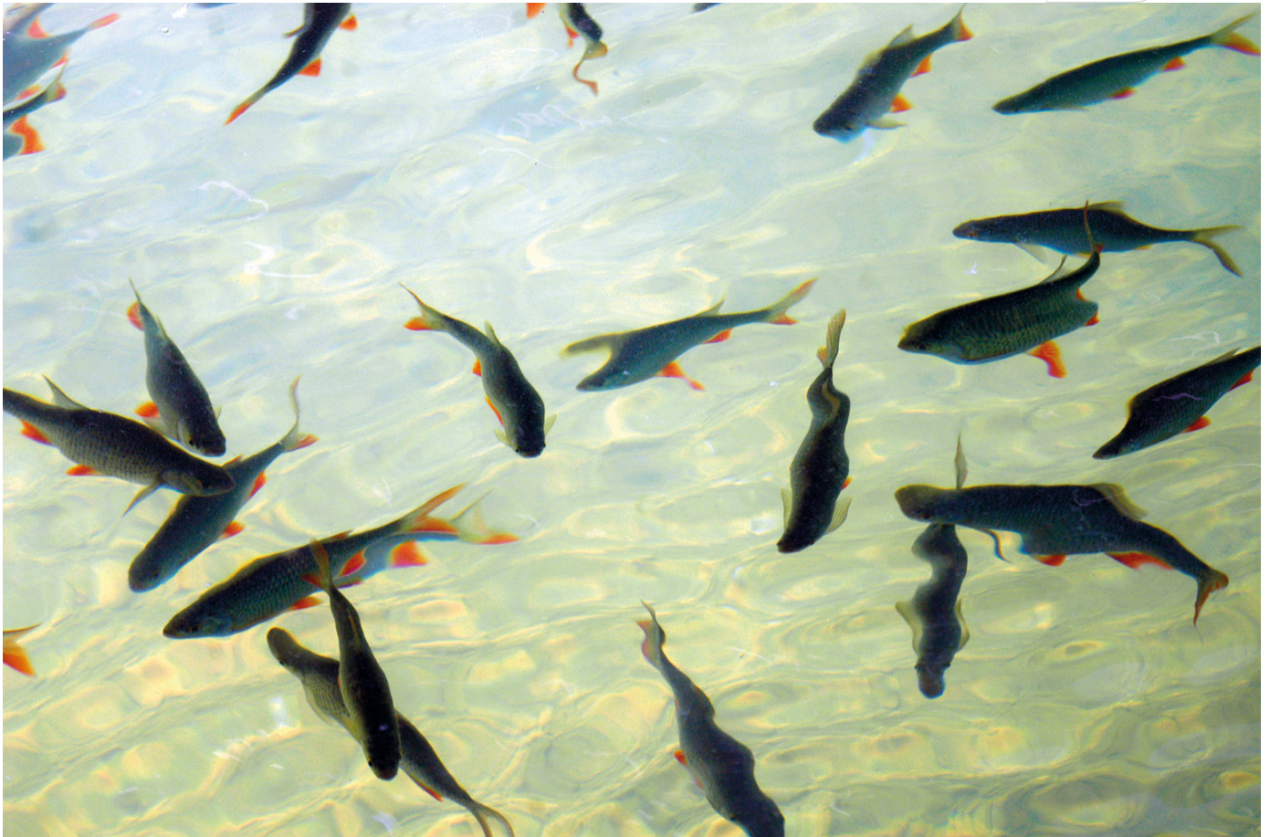
Rotfedern im Partwitzer See