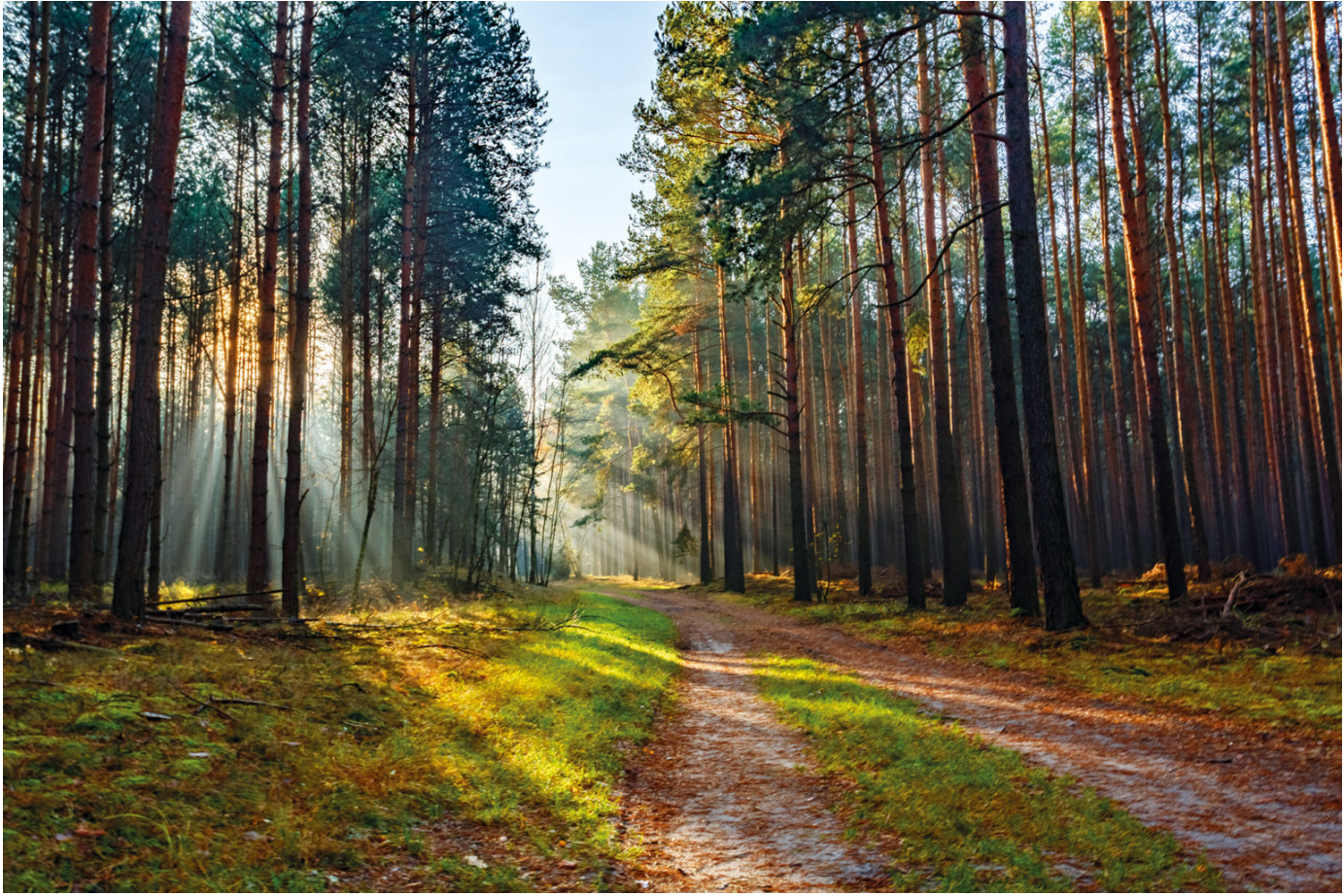
Aufgeforsteter Wald auf einer ehemaligen Lausitzer Kippenfläche