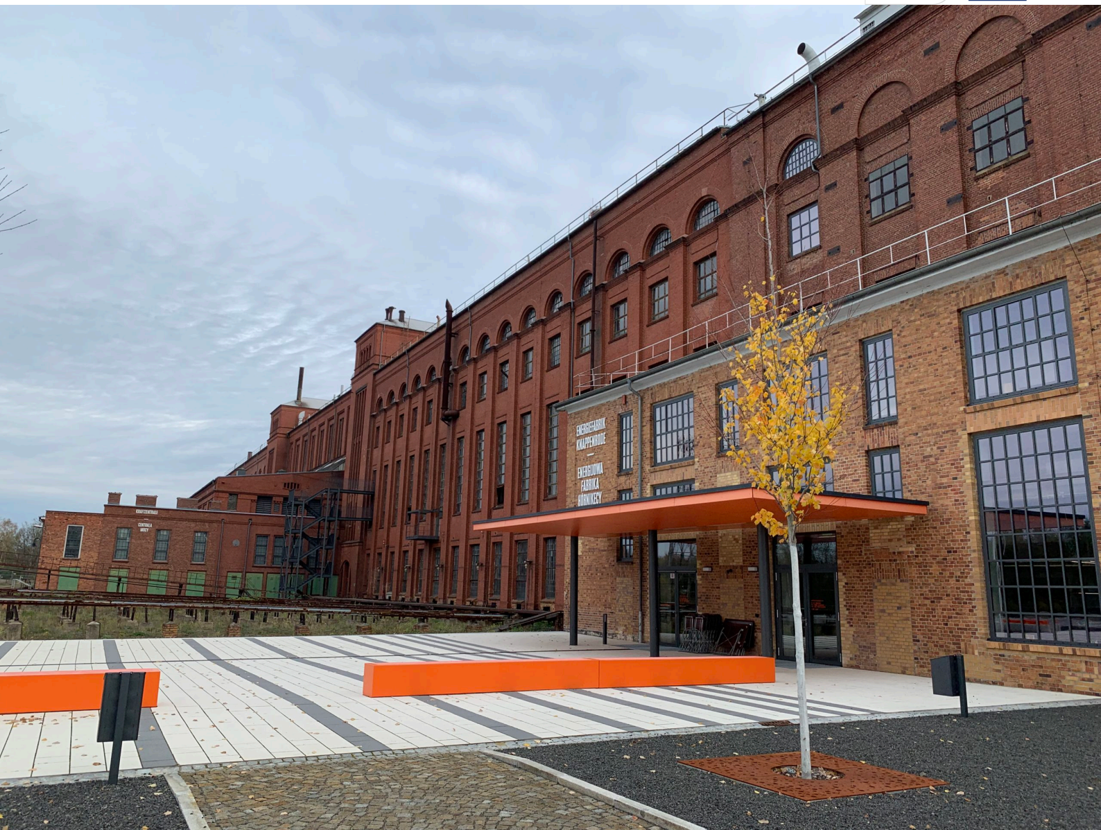
Eingangsbereich der Energiefabrik Knappenrode im November 2022