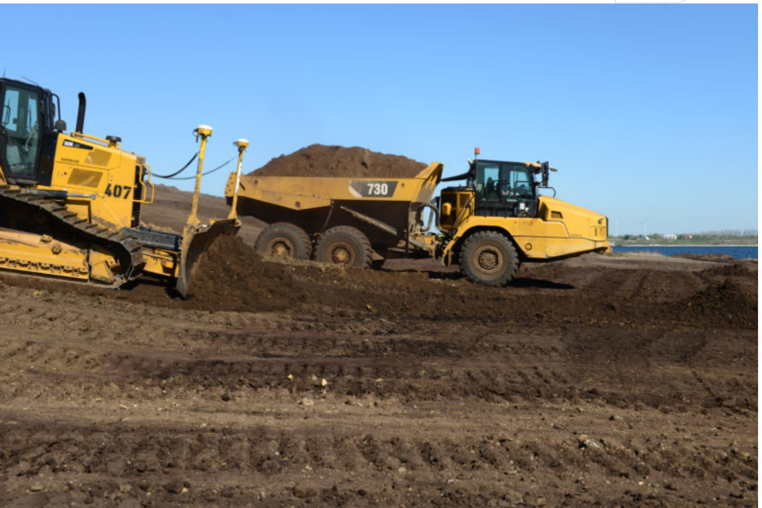
Böschungsgestalten am Großräschener Seeufer i.A. der LMBV

Zertifikat seit 2023 audit berufundfamilie