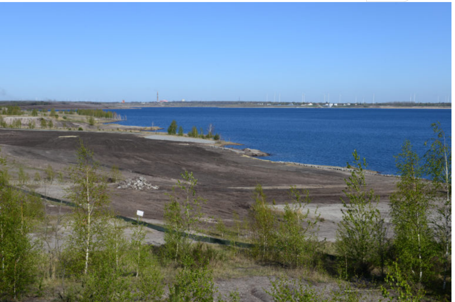
Sichtbare Ergebnisse der Böschungs-Endgestaltung am Großräschener See

Zertifikat seit 2023 audit berufundfamilie