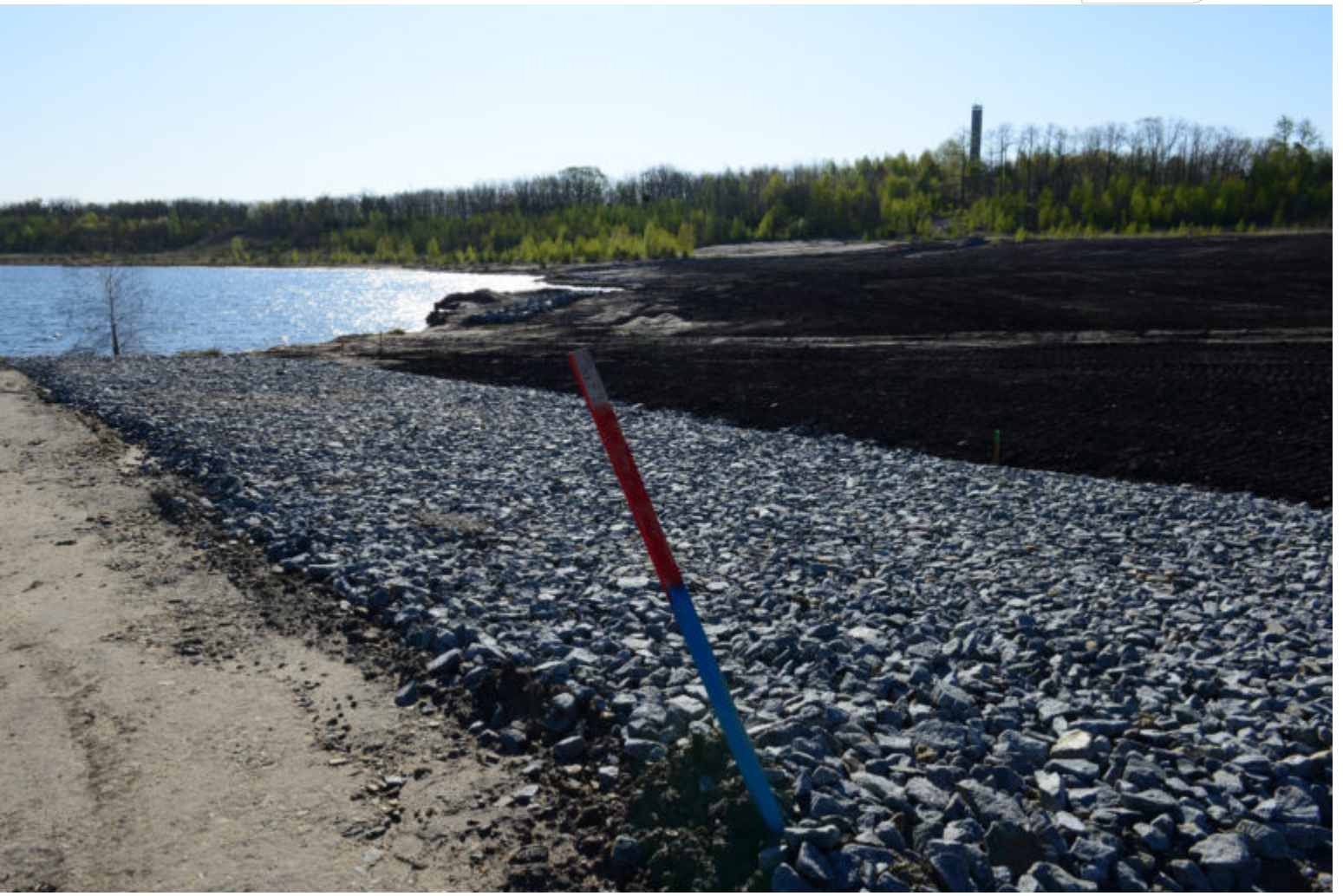
Verfüllung der Erosionsrinnen am Großbräschener See auf Sedlitzer Seite