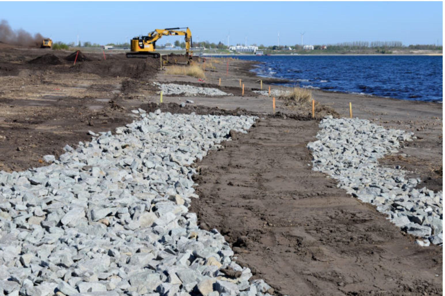
Böschungsendgestaltung am See