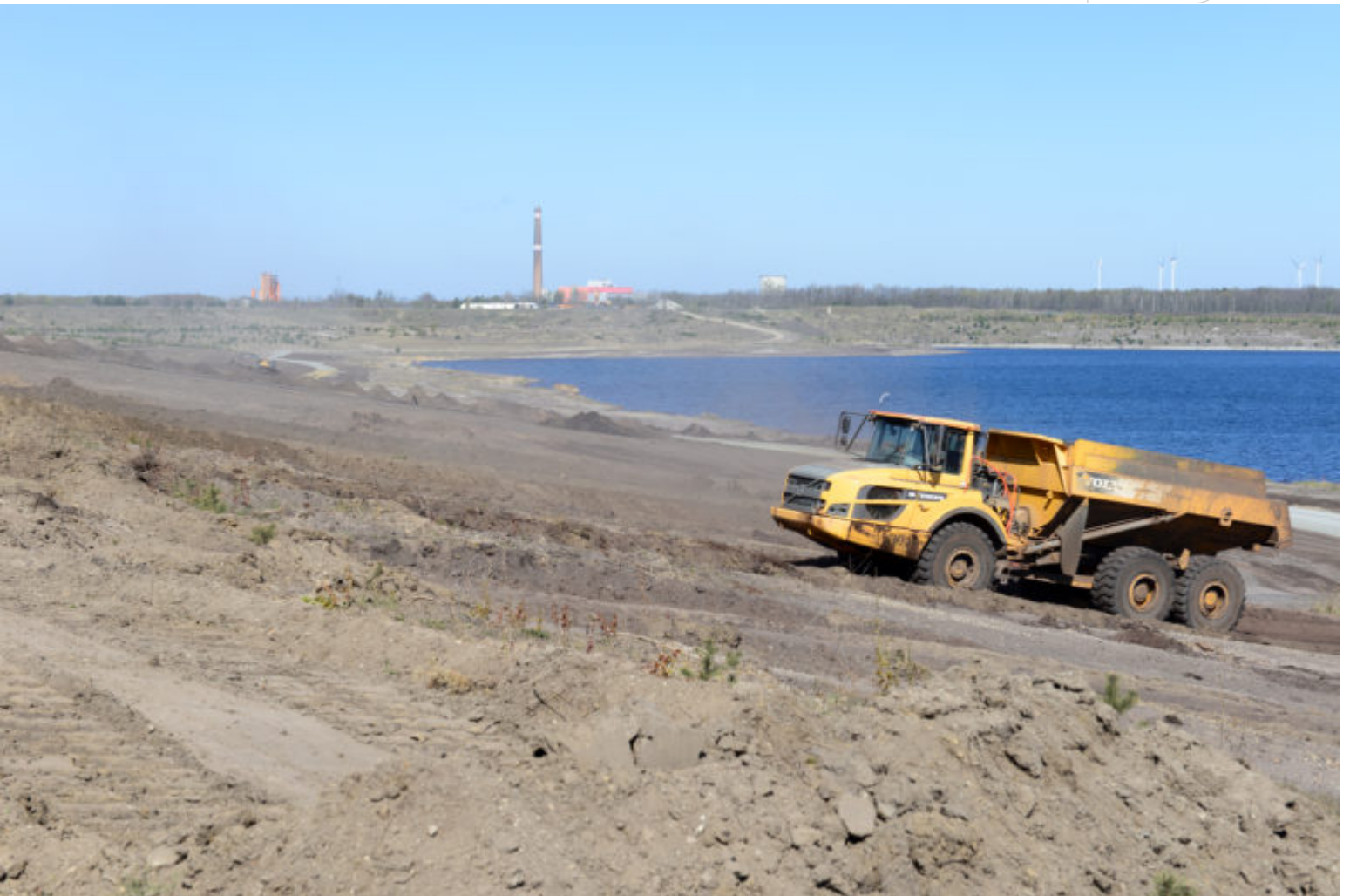
Massentransporte zur Böschungsgestaltung – Schornstein von “Sonne” im Hintergrund