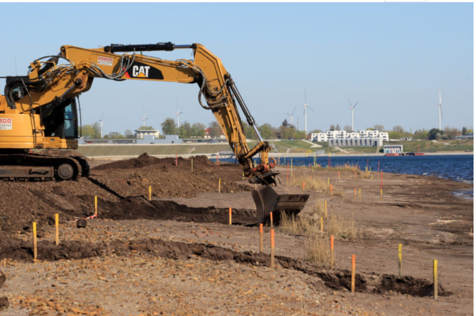
Böschungsgestaltung an Westufer des Restloches vom Tagebau Meuro

Zertifikat seit 2023 audit berufundfamilie