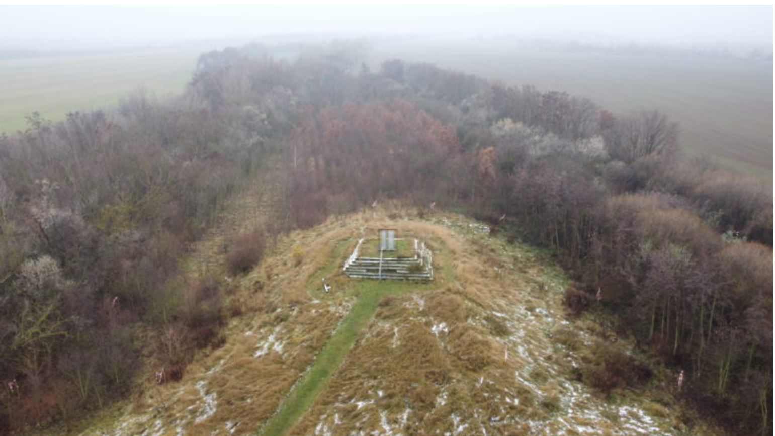
Auf dem Aussichtspunkt Stöntzsch nahe der Coburger Straße bei Pegau soll die Landmarke gebaut werden (Herrmann)

Planungsunterlage für den Aussichtsturm Stöntzsch Fotos vom Vorhabensbereich: LMBV/Ilka Sedlacek und Christian Herrmann