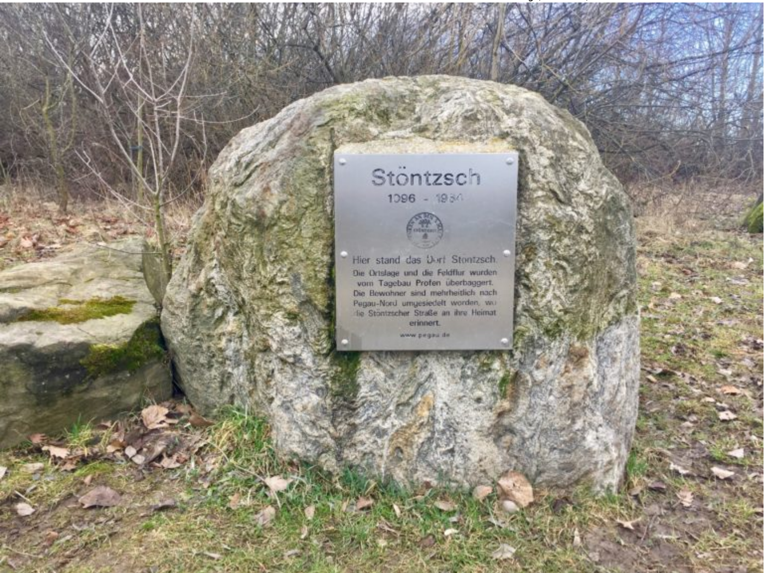
Gedenkstein für die devastierte Ortslage Stöntzsch (Sedlacek)

Ein Muster der drehbaren Informationstafeln für den Aussichtsturm stand zwischenzeitlich auf der Erhebung (Sedlacek)