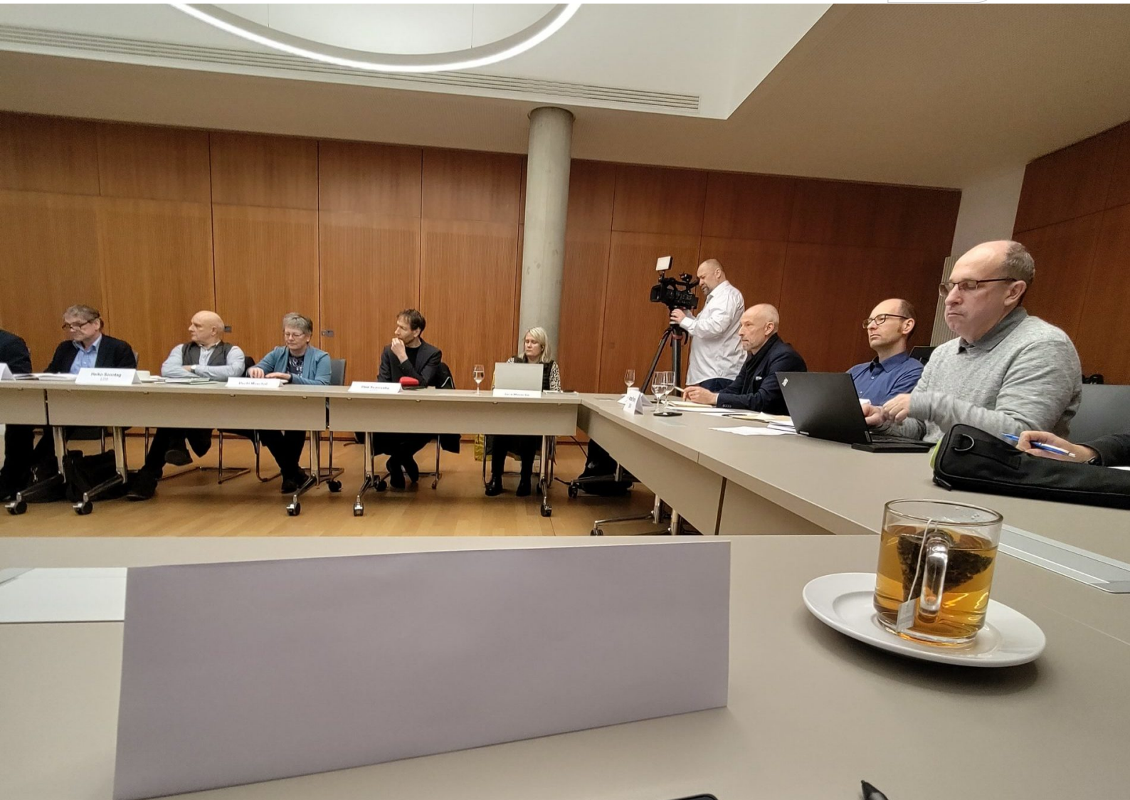
Pressegespräch im SMEKUL