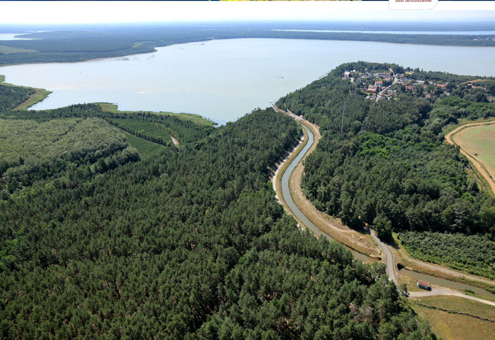
Auslauf aus dem LMBV-Restloch Burghammer in die Kleine Spree