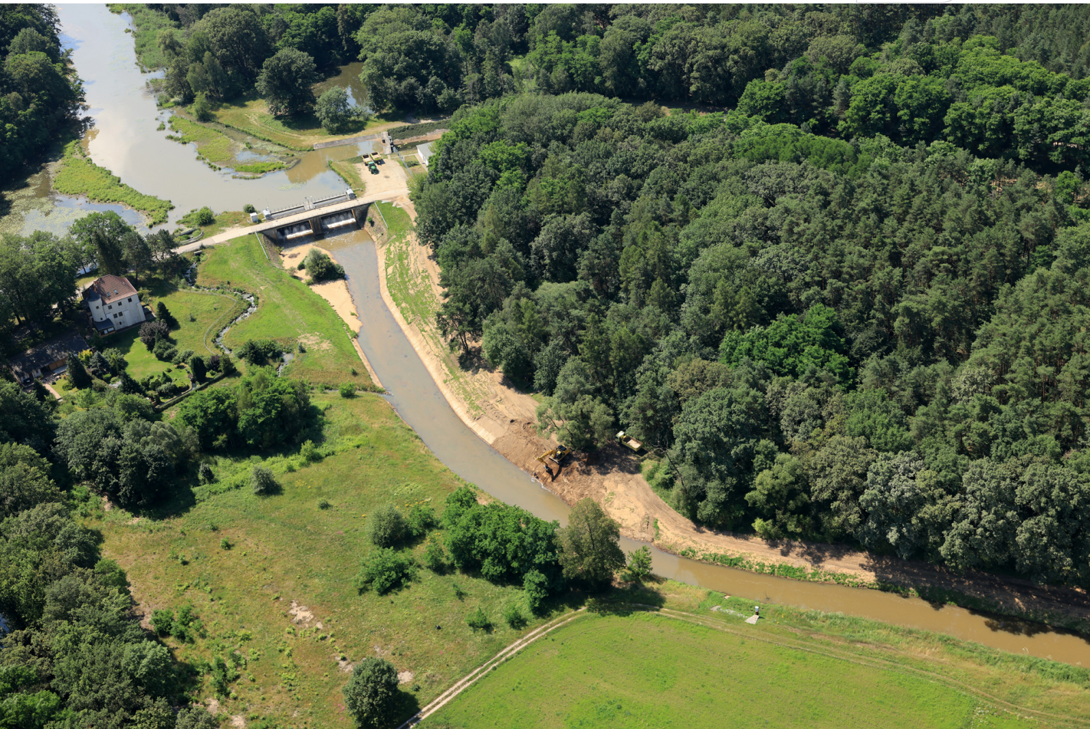
Zulaufanlage aus der Spree zum Speicherbecken Lohsa II