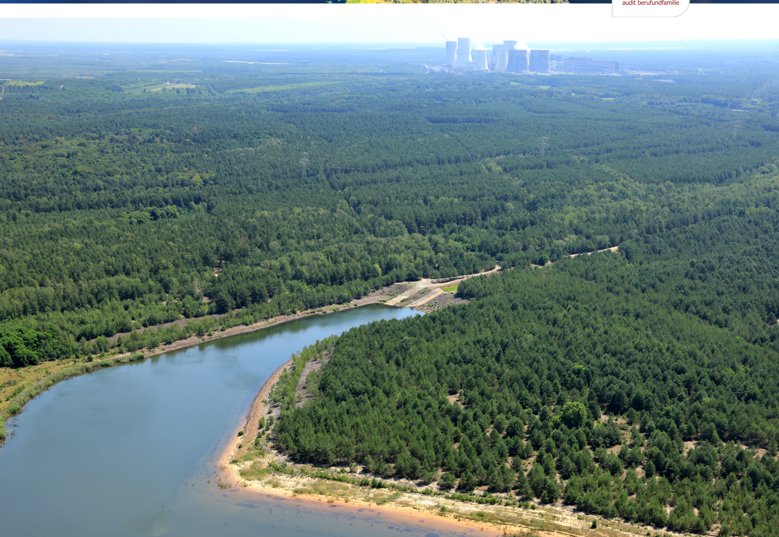
Spree-Zulauf zum LMBV-Speicherbecken Lohsa II