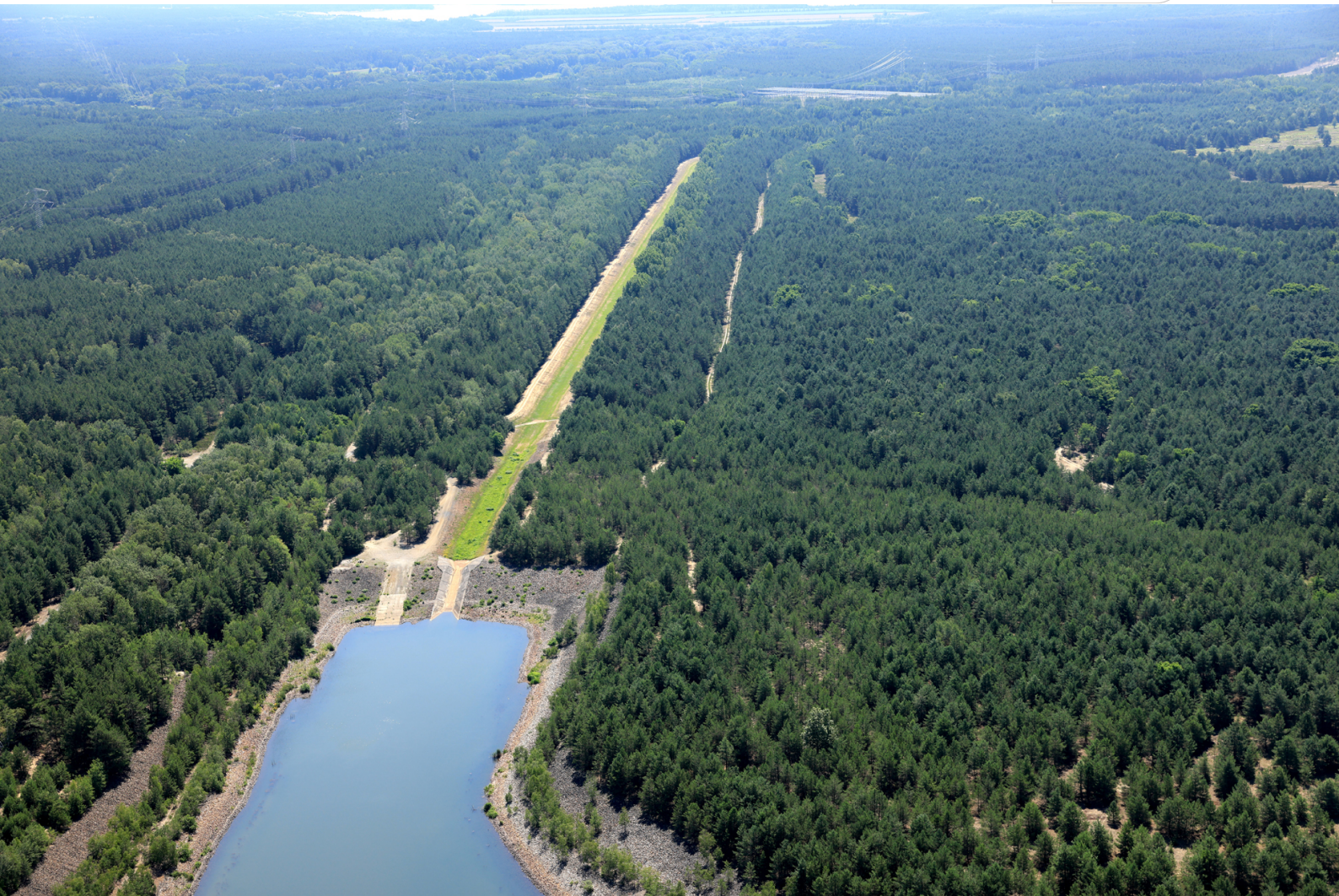
Zulauf zum Speicher Lohsa II - 2024