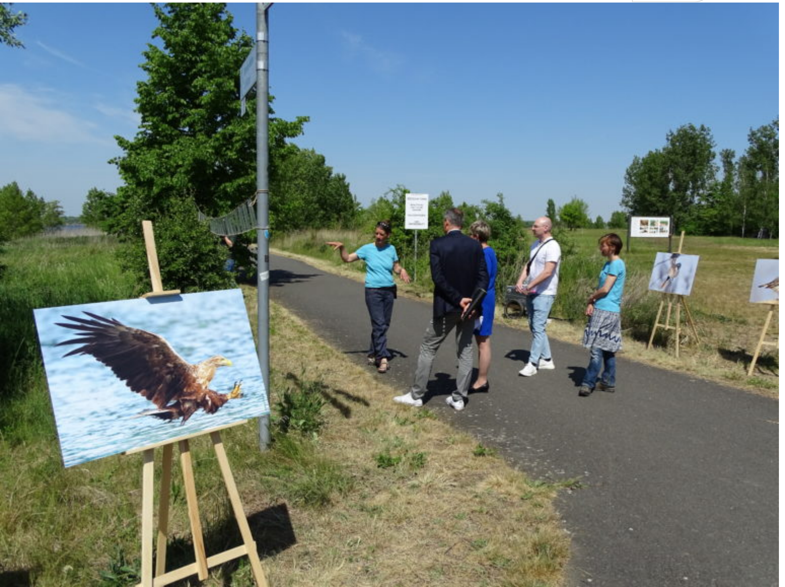
Der Seeadler ist das Wappentier des Naturschutzgebietes

Zertifikat seit 2023 audit berufundfamilie