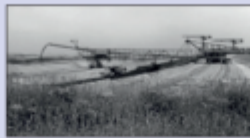
Abräumflörderbrückenkomplex in Betrieb, 1984

Dem Aufschluss des Tagebaus Delitzsch-Südwest gingen enorm aufwändige Vorbereitungen voraus. Die Entwässerung des Abbaufeldes südlich der Stadt Delitzsch begann 1975. Mit dem Aufschluss 1976 setzte sich der großflächige Abbau von Braunkohle nördlich von Leipzig fort, nachdem der Rohstoff bis dahin nur im Südraum gewonnen worden war. Der Tagebau sollte vor allem die Chemiekombinate Buna und Leuna sowie die Kraftwerke im Raum Bitterfeld / Gräfenhainichen mit Kesselkohle versorgen. Bis weit in das 21. Jahrhundert hinein sollte hier Kohle gefördert werden und sich die Grube bis dicht vor Leipzig bewegen. Im Zuge der Wiedervereinigung kam es ab Mitte 1990 zu einem drastischen Rückgang des Bedarfs an Braunkohle. Durch die vorzeitige und kurzfristige Stilllegung des Tagebaus 1993 verblieben mehrere Restlöcher mit Böschungen, die noch nicht für eine Folgenutzung gesichert waren, sowie plötzlich nutzlos gewordene Großgeräte.