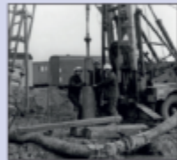
Einrichtung der Kondensatentwässerung, 1976