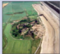
Im Abräum betrieblicher Ort Werbelin im Vorfeld des Tagebaus, um 1982