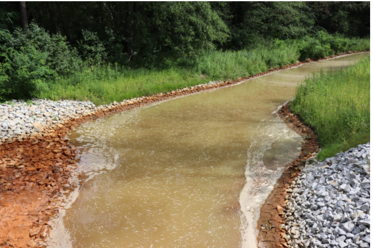
Altarm der Spree