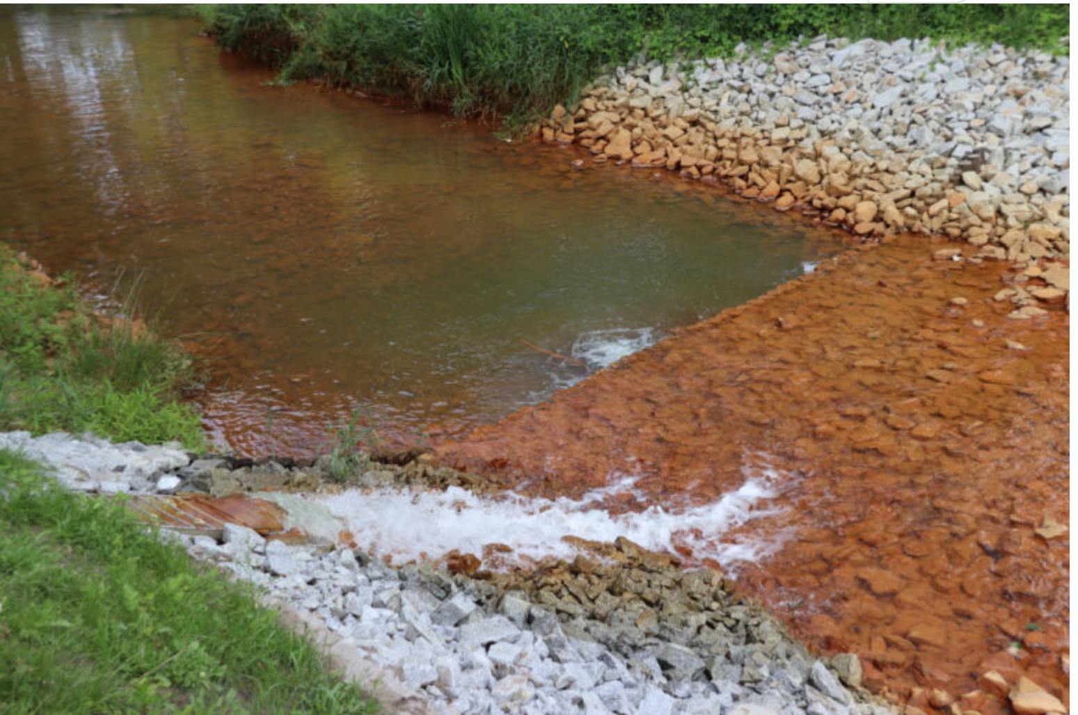
Gereinigtes Wasser strömt aus der Anlage

Zertifikat seit 2023 audit berufundfamilie