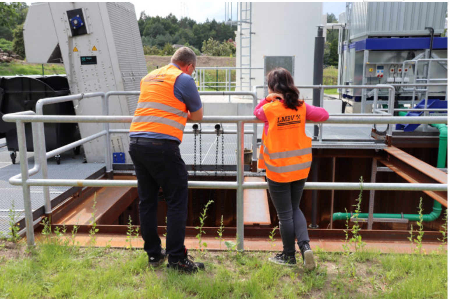
LMBV-Mitarbeiter vor Ort

Zertifikat seit 2023 audit berufundfamilie